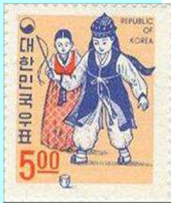
הצלפה בשוט מאיצה את הסביבון.

בנוסף לפורפרות קיים סוג נוסף של סביבונים המשמש למשחק בחוץ - סביבון השוט . לסביבון זה צורת גליל מחודד וראש רחב, בדומה לצורת מסמר או עפרון עבה מאוד בעל ראש. לסביבון נילוה שוט העשוי מחוט הקשור למקל. החוט נכרך לחלקו התחתון של הסביבון, שמוטח ארצה כמו הפורפרה הרגילה. כאשר סביבון השוט מאט את מהירותו, מצליפים בו מדי פעם כדי להאיץ אותו מחדש. הצלפה כזו דורשת מיומנות מיוחדת - אדם חסר ניסיון יגרום להעפת הסביבון למרחק ולא יצליח לחדש את סיבובו. בארץ שיחקו הילדים בסביבון שוט בימי המנדט. המנצח במשחק הוא זה שהסביבון שלו מסתובב זמן רב יותר. כיום ילדי ישראל אינם מכירים כלל את המשחק.