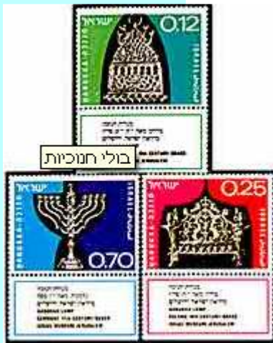
חנוניות עתיקות מארצות שונות

המלחמה וניצחון גיבורים ביד חלשים, ונפילת רבים ביד מעטים. אחת הסיבות לשינוי במשך הדורות לסיבה בעטייה נחוג החג הוא העובדה שאין זה חג מן התורה (שאותו אין משנים) וכן הרצון להנחיל לעם ערכים הקשורים לאותו דור ולאותה תקופה. מצבם הגרוע של היהודים בגולה והצורך לשרוד בנכר יצרו סיפור עם ערכים של עם חזק וגאה שיושב בארצו.