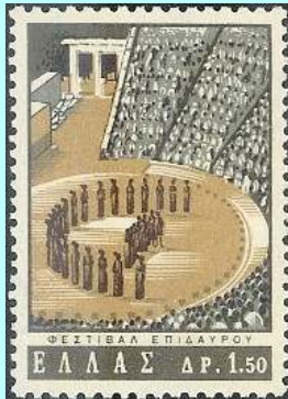
הצגת תיאטרון יווני

לא חייבים למות כדי להשתלב בתרבות היוונית, ומרבית האנשים העדיפו לעשות זאת בצורה נעימה בהרבה, על ידי ביקור בהצגת תיאטרון. היוונים היו אלו שהמציאו את הצגת התיאטרון כפי שאנו מכירים אותה גם כיום, והם היו הראשונים שהקימו מבנים מיוחדים לשם הצגת מחזות בפני קהל. השחקנים נהגו לעמוד במרכז המבנה, בחלק המכונה בשם "ארנה", כשפניהם אל הקהל שמילא את היציעים. מאחורי השחקנים עמדו חברי המקהלה, שנהגו לחזור על דברי השחקנים תוך שהם ממלאים את תפקידה של מערכת ההגברה ומאפשרים לצופים לשמוע את הטקסט. במקורות היהודות מופיעים איסורים שונים שהטילו חכמים כנגד ביקור בתיאטרון, אולם העם הצביע ברגלים ונהר בהמוניו אל במות הבידור היווני.