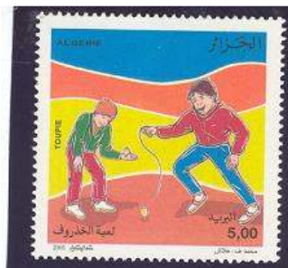
שחקנים מיומנים מצליחים להעלות את הפורפרה על כף היד.

במלזיה, באיי האוקיאנוס השקט ובחברות אחרות במזרח הרחוק, ממלאת הפורפרה את זמנם הפנוי של הגברים הבוגרים. בארצות אלה יש למשחק כללים ואסטרטגיה. במלזיה נערכות תחרויות כמעט בכל כפר. שתי קבוצות מתמודדות זו כנגד זו, כשחברי קבוצה אחת מפעילים מספר פורפרות בעוד חבר הקבוצה האחרת מנסה, בעזרת סיבוב הפורפרה שלו, להוציאם ממתחם שסומן מראש על הקרקע. כל התקפה מוצלחת מזכה את הקבוצה בנקודות ובעבור התקפה שנכשלת מוענקות נקודות חובה.