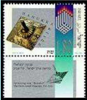
סביבון של בית-הספר לאמנות "בצלאל" תחילת המאה ה-20