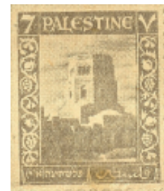
בול פלשתינה א"

עם כיבוש הארץ על ידי האנגלים, בשנת 1918, הונהג על ידי ממשלת המנדט שימוש בבולי פלשתינה, שהיו מיוצרים באנגליה. כך היה הדבר במשך 30 שנה!