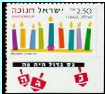
הנפקה משותפת לישראל וארה"ב בה יש שובל רק בבול הישראלי

ברגע שבחרו להדגיש שלא מוותרים על הרוחניות שלנו, במיוחד בגלות, סיפור החנוכה הפך לסיפור הנס העל טבעי וסיפור השמן הטהור והזך המדגיש את האמונה בקב"ה הדרושה בגלות כדי לשמר את הצביון היהודי. לעומת זאת, ברגע כשרוצים להדגיש את הגאווה לאומית מזכירים את גבורת המקבים ואת הניצחון של מעטים מול רבים. למעשה התפילה והמשנה נותנות לנו כל אחת פן אחר של הסיפור – גבורה לאומית מצד אחד ונס דתי מצד שני.