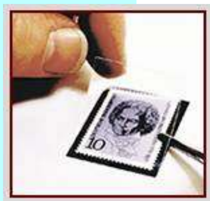
שמרבול שגודלו הותאם לבול

לא ניתן באמצעים פשוטים וביתיים למנוע לחלוטין את הפטרת. דרך פשוטה להפחתת הסיכון, היא השימוש בפינצטה המיוחדת לאחיזה בבולים. כך, לא יבואו הבולים במגע עם ידיכם. בנוסף, אפשר להעמיד את האלבומים בתוך ארונית סגורה, כאשר הם ניצבים (לא שוכבים זה על זה). וכמובן, מדי פעם לאוורר את הבולים על ידי דפדוף באלבום.