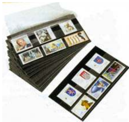
שמרבול למספר רב של בולים