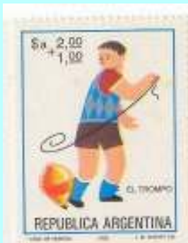
את הפורפרה מסובבים באמצעות חוט.

ברוב מדינות העולם נמצא את הפורפרה: חרוט העשוי (לרוב) מעץ ובקצהו חוד ממתכת. סביב הפורפרה מלפפים חוט, אוחזים בקצהו ומשליכים את הפורפרה הרחק מגוף השחקן בתנועה מהירה וחדה הדורשת ניסיון ומיומנות גדולים. באמצעות הפורפרה מבצעים להטוטים כגון: העלאת הפורפרה לכף היד בעודה מסתובבת.