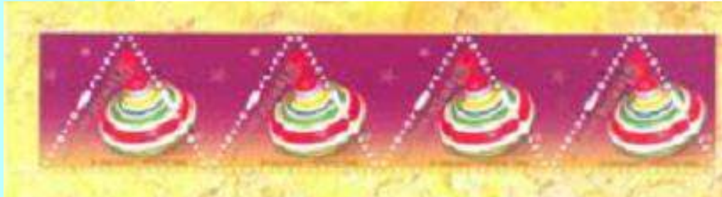
סביבון משאבה על בול משולש מפולין.

לערך), בהיותו גדול וקל להפעלה. סביבון המשאבה עשוי מפח. לאורכו נמצא ציר ספירלי ממתכת ובקצהו העליון ידית עץ. הסביבון מופעל על ידי משיכת הידית מעלה ומטה מספר פעמים, פעולה הגורמת לו להסתובב. ככל שמרבים במשיכה והורדת הידית, כך גדלה מהירות פעולתו של הסביבון. מקורו של סביבון המשאבה באירופה וכמו שהנפקות הבולאיות מראות, הוא פופולרי שם מאוד.