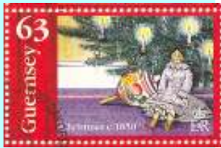
הסביבון היה פופולארי בתקופה הויקטוריאנית.

מהולנד וגרמניה עבר המשחק לצרפת ולאנגליה בתחילת המאה ה-18. במאה ה-19, בתקופה הויקטוריאנית, היו הסביבונים אופנתיים במיוחד באנגליה.