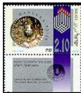
מטבע מימי מלחמת בר כוכבא

המקדש משלטון היוונים והמתיוונים, לאחר שתחת שלטונם שבת בית המקדש מפעילות שלוש שנים. אף שהמרד לא נגמר, והלחימה בארץ ישראל המשיכה כעשרים שנים נוספות, נקבע תאריך החג בימי השיא של המאבק - ימי שחרור המקדש וירושלים.