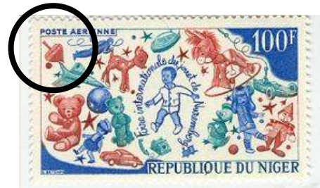
סביבון עם קנה אחיזה.

סביבון משאבה על גלית מירב משוויץ (הקטנה). כלי משחק שעל הלוח. הסביבונים המוכרים ביותר בארץ הם אלו עם ארבע פאות, אך בעולם קיימים גם סביבונים משושים ומתומנים.