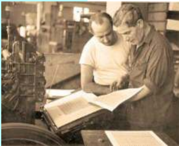
ביקורת ראשונית של בולי דאר עברי

ב-1948, מיד עם הכרזת העצמאות של מדינת ישראל, הופיעו למכירה בולי ישראל בכל משרדי הדואר. אולם נייר להדפסת בולים כמעט ולא היה בנמצא, ולכן ההנפקה הראשונה נעשתה בדחף ובחפזון. אפשר היה לראות זאת גם על גבי הבולים: היו בהנפקה הראשונה שוני בדפוס של הבולי, בנייר, ובנקבוב. (שלאספנים העוסקים במחקר הבולאי, הדבר בעל חשיבות רבה ביותר.)