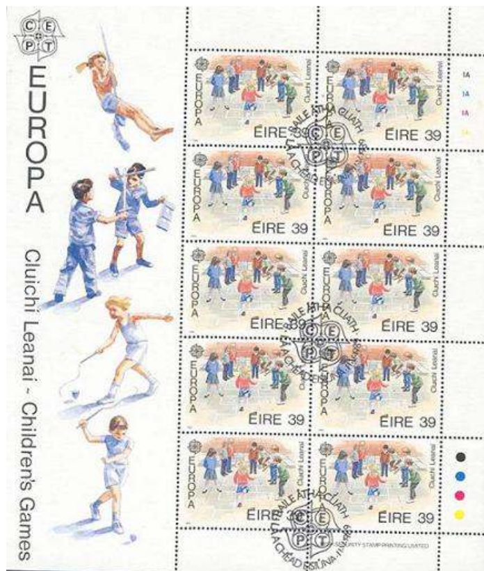
סביבון שוט בשולי גליון בולים מאירלנד (מובא בהקטנה).

במזרח הרחוק, הילדים משחקים בסביבונים בעיקר בחורף, תוך שהם מצליפים בסביבוני השוט על האדמה הקפואה. בקוריאה הסביבונים עשויים מעץ קשה, ובאיזורים דרומיים יותר מתרמילי גרעינים של פרחי הלוטוס, שבקצותיהם מוחדר חלק מתכתי המשמש כחוד. חוט משיכה נכרך מסביב, ומשיכה חדה של החוט גורמת לסיבוב הפורפרה. שחקנים מיומנים מסוגלים לסובבה על כפיס עץ צר ואפילו על חוט.