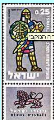
יהודה המכבי, צייר א. קלדרון

בשנת 167 לפנה"ס החל מרד החשמונאים נגד השלטון היווני בארץ ישראל, שכונה "מרד החשמונאים". בשנת 164 לפנה"ס הגיע המרד לשיאו בשחרור ירושלים ובית