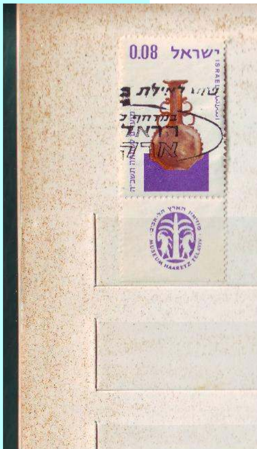
אלבום הנגוע כולו בפטרת

ובכן, גליון בולים, הוא מוצר סופי של שורה ארוכה של הרבה תהליכים. ראשית הדבר, בתכנון ההנפקה. ההנפקה הינה תהליך ארוך, בו מפורסמים מכרזים בין האומנים, נעשה מיון של ההצעות המתקבלות על ידי ועדות מומחים, אישורו של נושא היצירה, והכנתו להדפסה. בשלב הבא, נכנסת לתמונה איכות הנייר, יצורו, מריחתו בדבק, שכפול ציור הבול, העברתו לנייר דבק, חיתוך לגליונות קצרים וניקוב, בקורת טיב, וכמובן – חלוקת הבולים בין משרדי הדואר. כך שהינכם רואים, כי הפקתו של בול, הינה מפעל של ממש!