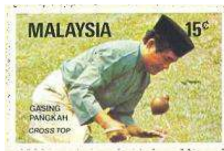
במלזיה הפורפרות הן משחק לאומי.

הקבוצה בנקודות ובעבור התקפה שנכשלת מוענקות נקודות חובה.