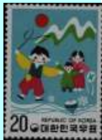
בקוריאה משחקים בסביבוני השוט בחורף.