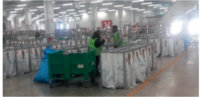
מיון המשנה של החבילות מהעגלה הירוקה לשקים השונים, המייצגים את נקודות המסירה הסופיות

P.O.Box 8101 — TRENTON NJ 08650 USA E-mail: LEADSTAMP@VERIZON.NET Phone: 609-456-9508