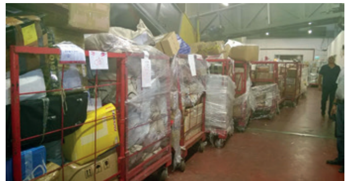
מיון הדואר בבית המיון הישן בתל אביב. בית המיון החדש במודיעין נועד להחליף את בתי המיון הישנים בתל אביב, חיפה וירושלים ואת שיטת המיון הישנה