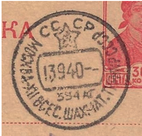
גלוית ההדפס עם חותמת מוסקבה 1940 מאוספו של יורם

התעריף התקני למשלוח גלויה עמד על 20 קופיקות בלבד, כך ששולח הגלויה שילם למעשה 50% מעל התעריף הנדרש והפסיד 10 קופיקות. באוספו של ג'ון אדוארדס, נשיא האגודה האמריקנית לאיסוף בולי שחמט, מופיעה גלוית הדפס נוספת עם חותמת האירוע של התחרות מהתאריך 13.9.1940, וניתן להבחין כי בשתי הגלויות זהות השולח זהה, כמו גם כתובת הנמען וכתובת המען וכתב היד. אולם, בעוד הפריט של יורם כולל עודף ביול, בפריט של אדוארדס הביול תקין ותואם למערכת התעריפים שהייתה נהוגה באותה העת.