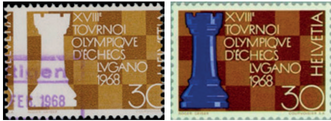
בול השחמט שהונפק ב־1968 בגרסה התקנית (מימין) ובגרסה עם השגיאה הכפולה (משמאל)