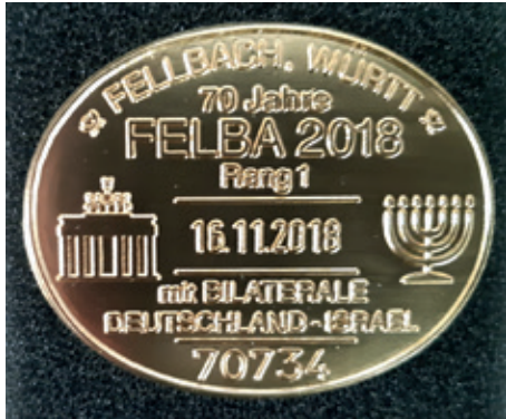
חותמת התערוכה עם מנורת שבעת הקנים על מדליית התערוכה