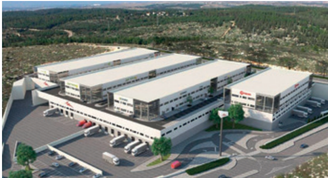
הדמיה של מרכז המיון החדש במודיעין של חברת דואר ישראל. המרכז כולל כ־18,000 מ"ר הערוכים לקליטת כ־100 מיליון חבילות בשנה. מרכז המיון ממוקם במודיעין בשל הקרבה לשדה התעופה, ממנו מגיעות החבילות המיובאות ישירות למרכז המיון, ולעורקי התחבורה העיקריים. בשטח זה ממוינים כ־12,000 פריטים בשעה

הנחת העבודה בתכנון מרכז המיון הייתה שכמות החבילות המיובאות לארץ ייבוא ישיר – ללא תיווך של יבואנים – תמשיך לצמוח בשנים הקרובות. לפי האומדנים, נתח המסחר האלקטרוני היווה בשנת 2016 כשישה אחוזים מכלל השוק הקמעונאי ברחבי ועולם, ולפי ההערכות שיעור זה יוכפל עד 2020. נכון להיום, הישראלי הממוצע רוכש כ־36 חבילות באמצעות אתרי הסחר מקוון בכל שנה. בפברואר 2019 הוגדל השטח התפעולי של דואר ישראל במודיעין לכ־28,000 מ"ר, ובסוף 2019 יורחב השטח לכ־32,000 מ"ר ויכלול את משרדי יחידות הדואר של המחוזות השונים בארץ, אשר יהוו יחידה תפעולית אחת שתיקרא "הקרית הדוארית". במרכז המיון המקוון ישנם כיום כ־250 עובדים.