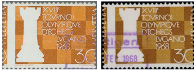
שני הבולים החתומים הידועים עם טעות זאת. רציפותה של החותרמת מעידה כי שני הבולים הופיעו זה לצד זה, הופרדו בהמשך והוצעו למכירה בנפרד

לאחר חיפושים ברשת האינטרנט, נמצאה המעטפה היחידה עליה מופיע הבול בגרסתו השגויה: מכתב זה נשלח מסניף דואר זעיר עם ביול שגוי וחותרמת מהתאריך 14.3 – יום הופעת הבול. לפי מאפיינים אלה ניתן לקבוע כי זוהי "מעטפה מעושה" (פילאטלית), שנוצרה באופן מלאכותי על ידי אספן. לאחר חיפוש נוסף, הצליח יורם לשים את ידו על תמונת הבול החתום הנוסף הידוע משגיאה זאת, וניתן להבחין כי המסגרת של החותרמת הסגולה נמשכת באופן רציף בשני הבולים.