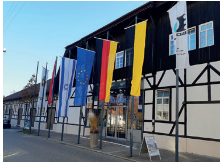
דגל ישראל מתנוסס בכבוד בשדרת הדגלים שבחזית אולם התערוכה "פלבה 2018"

כות רבה נפלה בחלקי להתמנות כקומיסר ל"פלבה 2018" (FELBA 2018) – תערוכת בולים משותפת לישראל ולגרמניה שהתקיימה בעיירה פלבך שגרמניה בין התאריכים 16-18 בנובמבר 2018. המשלחת הישראלית כללה, מלבדי, את יצחק ברק כשופט בתערוכה ויהושע אלישיב שהציג את אוספו.