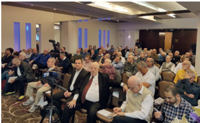
קהל הרחב מילא את אולם הכנס

מועדים התש"פ (ספטמבר) – במסגרת סדרת הבולים הרב־שנתית תופיע גיליונית זיכרון ייחודית עם שלושה בולים שיונקבו כל אחד בצורה של תפוח. שלושת בולי הסדרה יוקדשו לשלושה סוגים שונים של דבש – דבש הדרים, דבש אקליפטוס ודבש פרחי בר.