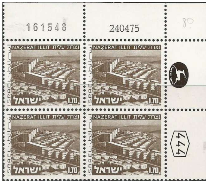
ההדפסה החדשה משנת 1980

הדפסה מחודשת של בול מן המניין אינה מהווה פעולה חריגה, והדואר ביצע זאת פעמים רבות בעבר. לפיכך קשה להבין מדוע בחרו אנשי השירות הבולאי לנסות ולהסתיר מן הציבור את העובדה שבוצעה הדפסה חוזרת של בול "נצרת עילית".