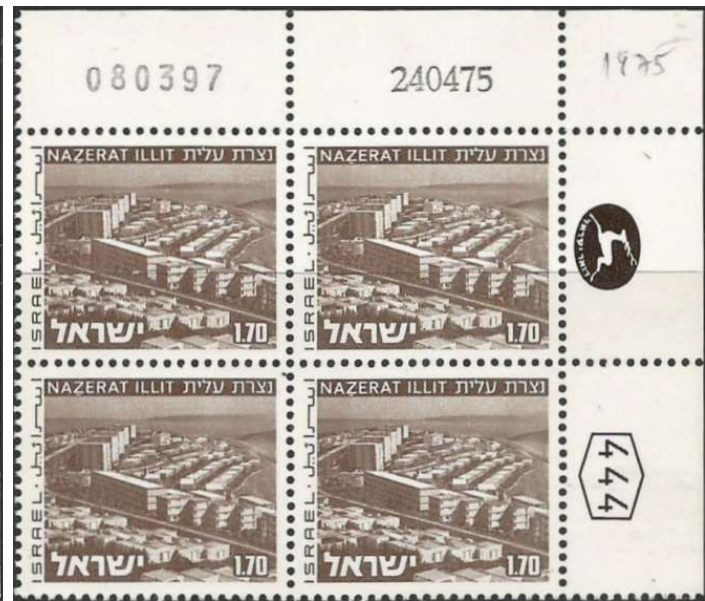
ההדפסה המקורית מ-17.6.1975

במועד לא ידוע בשנת 1980 הודפס הבול מחדש, אולם אנשי השירות הבולאי בחרו להדפיס בשולי הגיליון את התאריך של ההדפסה המקורית משנת 1975. למרות ניסיון ההסתרה התגלו הבדלים בין הבולים שמקורם בהדפסות השונות.