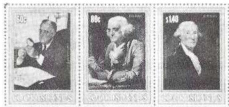
נושא חדש: שנת רוזנולט

הערכים הם: 1 סנט, 4 סנט, 13 סנט, 17 סנט, 20 סנט, ו-5 דולר.