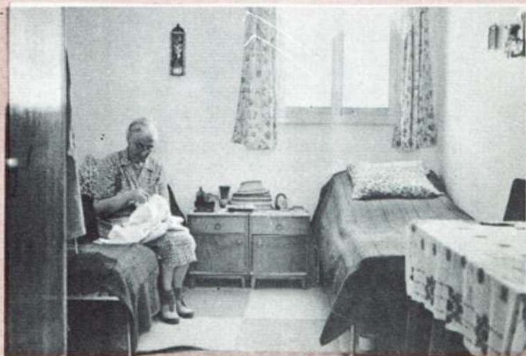
בבית הורים של "מלבן" AT A "MALBEN" HOME FOR ELDERLY IMMIGRANTS