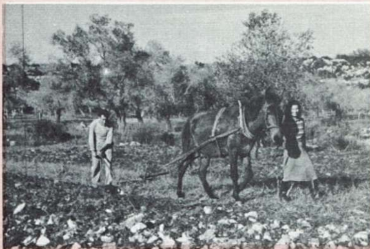
עבודה חקלאית בשיכון עולים WORKING THE FIELDS OF A NEW SETTLEMENT