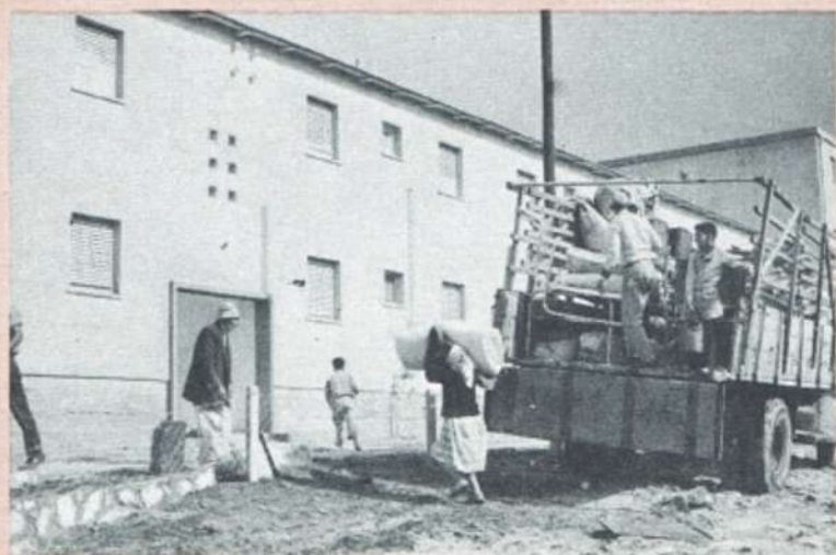
העולים מובאים מהנמל אל שיכונים חדשים IMMIGRANTS MOVING INTO NEW HOUSING ESTATES