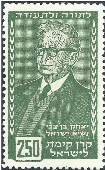
בול קי"ל הראשון לכבודו של הנשיא יצחק בן-צבי, משנת 1954.

בשנת 1907, כאשר סכנת מאסר עקב פעילותו הציונית מרחפת מעל ראשו, עלה בן-צבי ארצה. באותה שנה הוא שימש כציר מטעם פועלי ציון בקונגרס הציוני שנערך בהאג, והקים את ארגון השמירה היהודי הראשון "בר גיורא". שנתיים מאוחר יותר הוחלף ארגון מחתרתי זה על ידי ארגון "השומר", שהיה ארגון חוקי וגדול הרבה יותר.