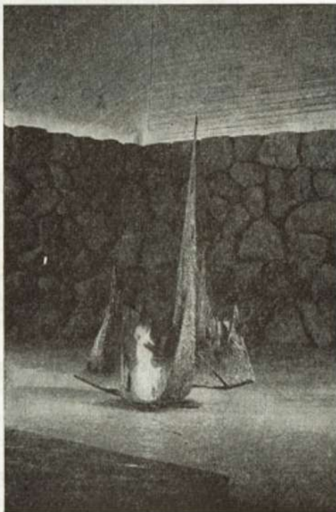
נר תמיד באהל יזכור

The Jewish nation in Israel and abroad will never forget either the holocaust or the heroism of those who fell in defence of Israel's honour. The 27th day of Nissan has been established by the law of the Knesset (Israel Parliament) as Martyrs' and Heroes' Memorial Day. On this day the nation remembers the victims of the holocaust and the heroes who sacrificed their lives in sanctifying the name of Israel.