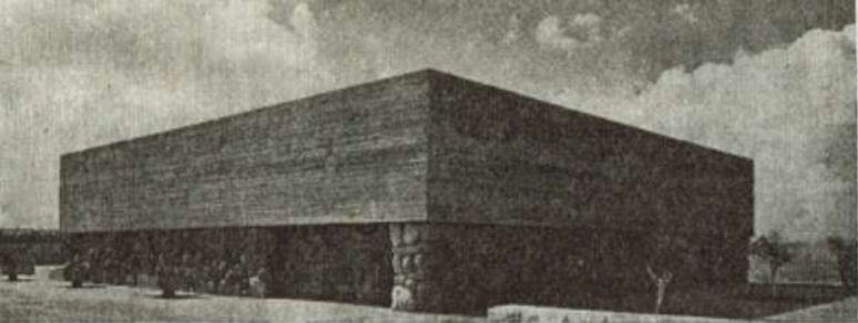
משכן הזיכרון של יד ושם בירושלים

MEMORIAL SHRINE TO THE VICTIMS OF THE HOLOCAUST, JERUSALEM