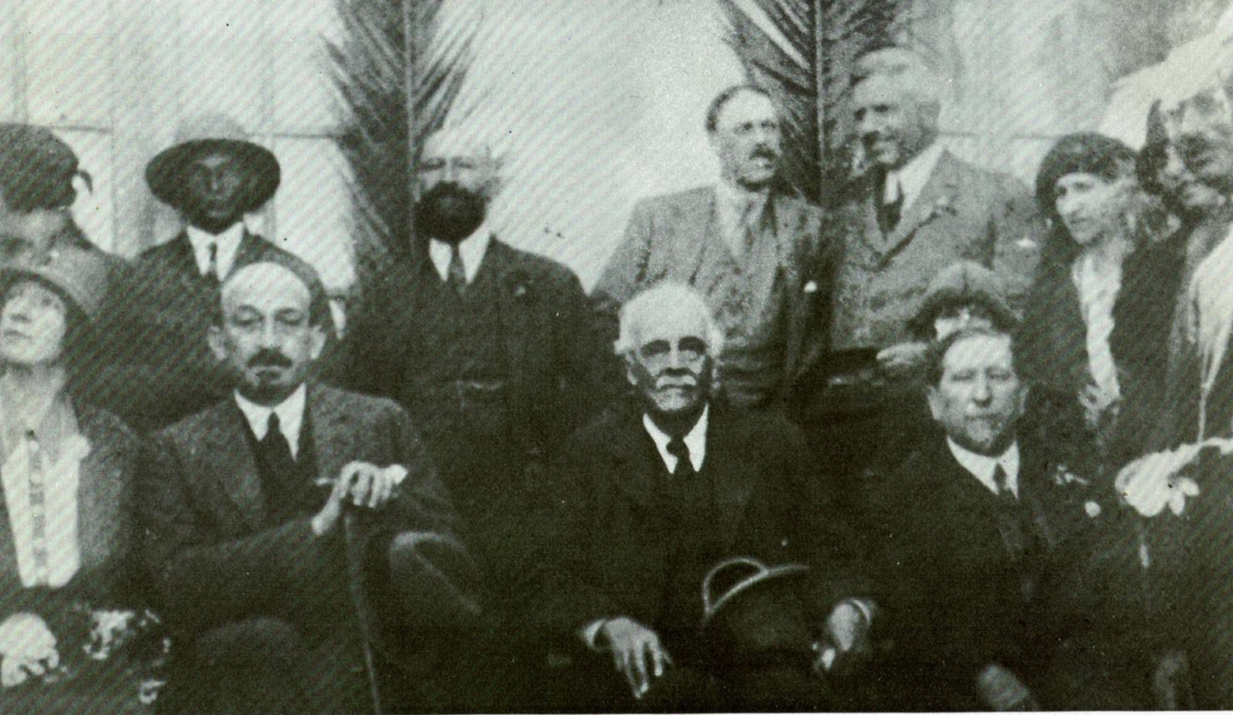
לורד בלפור וד"ר וייצמן בראשון-לציון (1925) LORD BALFOUR AND DR. WEIZMANN AT RISHON LEZIOYON (1925)