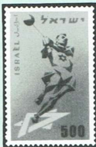
בול 25 שנה מכביה