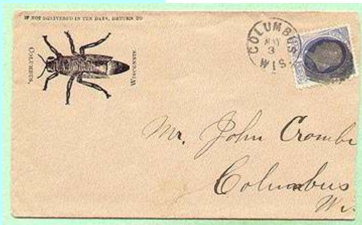
מעטפה עם פרסומת מארה"ב, ציור של דבורה מסוף המאה התשע עשרה

הרמב"ם, מגדולי חכמי ישראל שהיה רופא, ייחס ערך רב לשימוש בדבש כתרופה. גם היפוקרטס, אבי הרפואה המערבית קבע כי לדבש סגולה לריפוי פצעים בזכות תכונתו האנטיספטית. גם הסבתות שלנו נהגו להשתמש בדבש נגד כאבי גרון והצטננות.