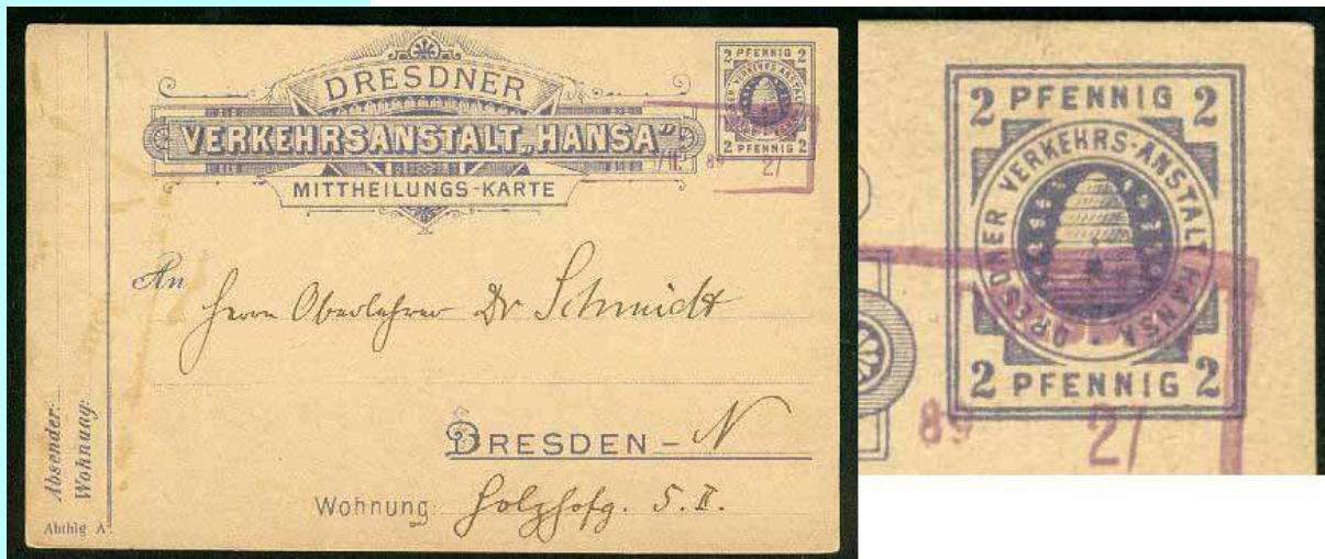
דבר בולים - גליה ועליה בול מצויר בדמות כוורת, גרמניה, 1889.

הדבש גם מכיל ויטמינים ומינרלים- נתון, סידן וברזל. למרות מתיקותו הרבה הוא מכיל פחות קלוריות מסוכר תעשייתי לבן ולמעשה, בשל ריכוז הסוכרים הגבוה שבו, הוא אינו מתקלקל לעולם.