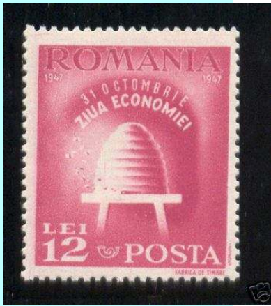
בול מרומניה - 1947, ציור של כוורת דבש מהסוג שהיה נפוץ באירופה. כוורת כזו נהרסה כל פעם שהוציאו ממנה את הדבש והדבורים נאלצו לבנות את כולה מהתחלה

מהיכן מגיע הדבש? מהדבורה כמובן. גודלה של הדבורה לא עולה על 2 ס"מ, ולמרות שהיא כל כך קטנה היא מתפקדת ממש כמו בית מלאכה נייד. הדבורה מתעופפת לשדות הפרחים, מוצצת את הצוף וחוזרת לכוורת, וכבר בשלב זה מתחיל ייצור הדבש. על מנת ליצר ק"ג אחד של דבש נחוצות לפחות אלף דבורים וכחמישה מליון פרחים.