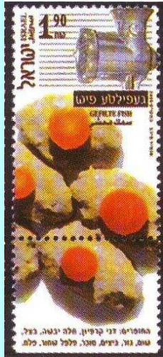
מאכלים בישראל: גפילטע פיש, 2000

אגב, תמיד אפשר להוסיף ברכה משלכם. למשל - לאכול צימוקים ולבקש "יהי רצון שיצטמקו צרותינו", או לאכול אפונה ולברך "יהי רצון שנצליח בכל אשר נפנה". נסו לחשוב על ברכות חדשות ויצירתיות.