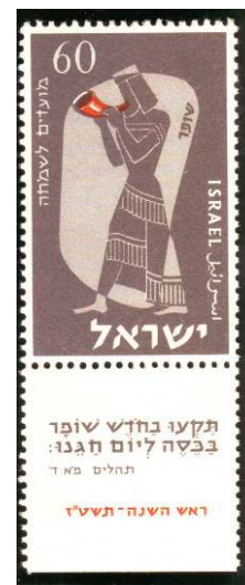
מועדים לשמחה 1955

נשלחות דרך האינטרנט, באמצעות הדואר האלקטרוני.