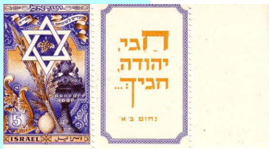
ארבעת המינים, מועדים לשמחה, תש"ך

בראש השנה נהוג לאכול מאכלים שונים אשר מסמלים עבורנו תקווה לדברים הטובים שיאפיינו את השנה הבאה. אנחנו מבקשים דברים אשר קשורים לשמו של המאכל אותו אוכלים. כל בקשה מתחילה במלים: "יהי רצון מלפניך ה' אלוהינו ואלוהי אבותינו..." וממשיכים בבקשה הרצויה. רוצים דוגמאות? בבקשה: לאחר אכילת כרישה אומרים "יהי רצון ... שיכרתו אויבינו ושונאינו וכל מבקשי רעתנו". לאחר אכילת