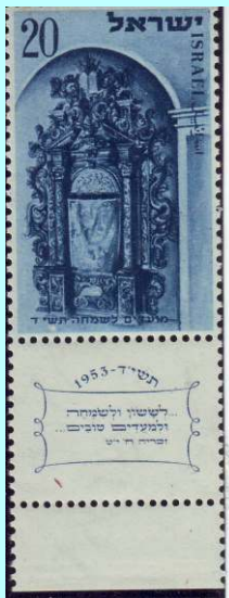
מועדים לשמחה פרוכת לבנה 1953

השופר שבו תוקעים בראש השנה, צריך להיות מקרן איל (כבש זכר) מעוקלת, שאורכה עולה על 10 ס"מ. קרן האיל מזכירה לנו את מסירות הנפש של אברהם אבינו בניסיון העקידה.