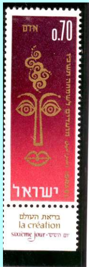
מועדים לשמחה, תשכ"ו, סיום הבריאה

ראש השנה הוא יום הדין: בו נקבע דינו של כל אחד מבני העם היהודי לשבט או לחסד. כל אחד מאתנו נדון על מעשיו הטובים ומעשיו הרעים בשנה החולפת. מדוע? כי בראש השנה נגמרה על פי האמונה היהודית בריאת העולם, וביום זה, על פי האמונה, חזר אדם הראשון בתשובה ונמחל לו על מעשיו. בימי ראש השנה נוהגים להחליף את הפרוכת שמכסה את ארון הקודש בבית הכנסת לפרוכת לבנה, כסמל לכך שחטאינו "כשג ילבינו".