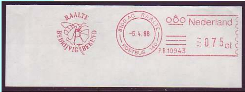
חותמת ביול מהולנד

צמחים וכ-181 מרכיבים בסך הכל. כ-80% מהפחמימות שבדבש הם סוכרים הנספגים במהירות בדם, מה שעושה אותו חביב על ספורטאים כמעורר ומגביר אנרגיה.