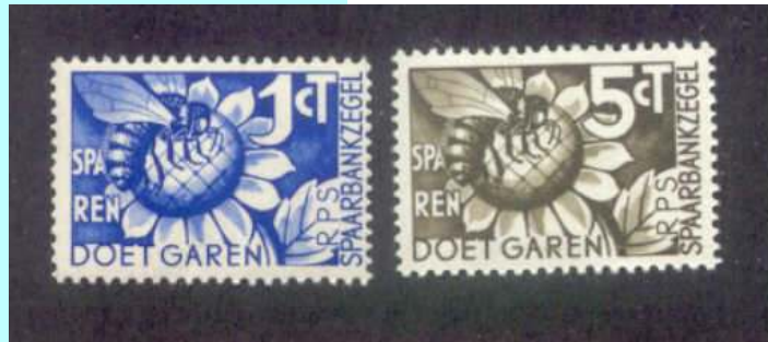
זוג בולים - למעשה לא בולי דואר אלא בולי חסכון הולנדיים. הדבורה מופיעה עליהם כסמל לחסכון.

נוזלים, וכך הוא מותאם ליניקת צוף מהפרחים, להאכלת הזחלים והמלכה, לפליטת מים לצורך קירור הכוורת ועוד. לדבורה שני זוגות כנפיים ושש רגליים. על הרגליים יש לדבורה מעין מסרקות המיועדות להעברת אבקת הפרחים שהיא אוספת מהרגליים הקדמיות לאחוריות. עד להבאתם אל הכוורת מאחסנת הדבורה את האבקה בשקערוריות הנמצאות ברגליה האחוריות הנקראות "סלילות אבקה".