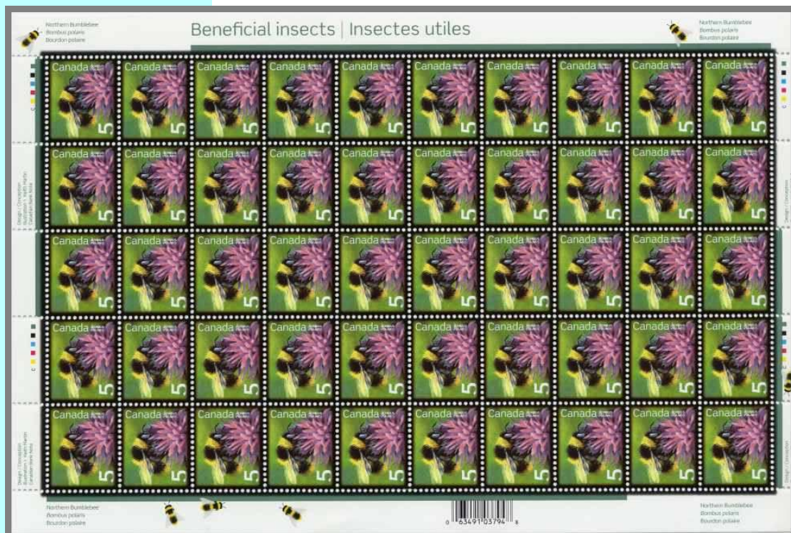
גליון שלם - בול קנדי מסדרה המראה חרקים מועילים: שימו לב לדבורים היוצאות מהציור והולכות לטייל על שולי הגליון.

גוף הדבורה, כגופם של כל החרקים, מורכב מראש, חזה ובטן. בראשה חמש עיניים, שני מחושים ופה. הפה מורכב משפה עליונה, זוג לסתות המותאמות ללעיסה וחיתוך