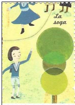
La soga חבל