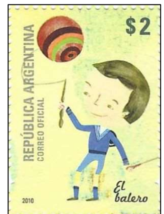
El balero כדור על חוט