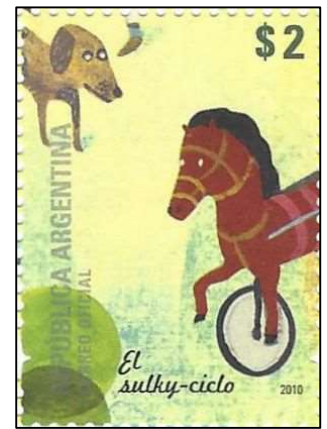
El sulky-ciclo תלת אופן