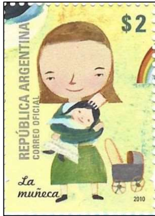
La muñeca בובה