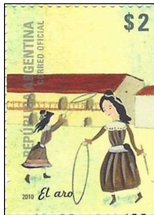
El aro חישוק