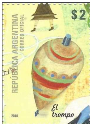
El trompo סביבון