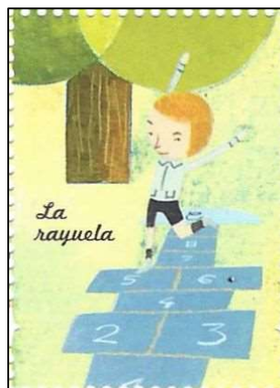
La rayuela קלאס