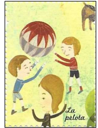
La pelota כדור