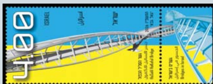
גשר הסליל הכפול לוח: 1318

ערך נקוב של כל בול: 4.00 ש"ח, מידות הבולים (מ"מ): ג 30 x ר 40 בולים בגיליון מוקטן חריג: 8, שבליים בגיליון: 8, עיצוב: יגאל גבאי שיטת הדפסה: אופסט, סימון אבטחה: מיקרוטקסט, דפוס: AKD קרואטיה 2 מעטפות היום הראשון. מחיר כל מעטפה: 5.00 ש"ח מקומות החתמה: