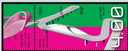
גשר הכרם לוח: 1318