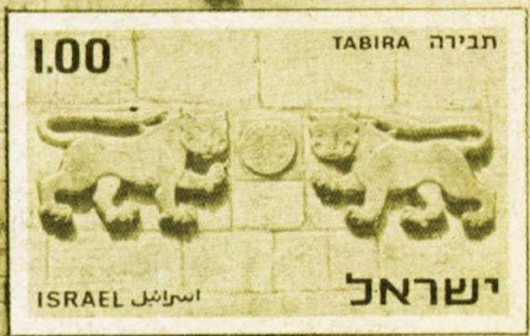
LIONS' GATE שער האריות