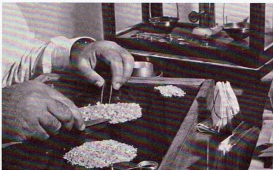
...and carefully sorted.