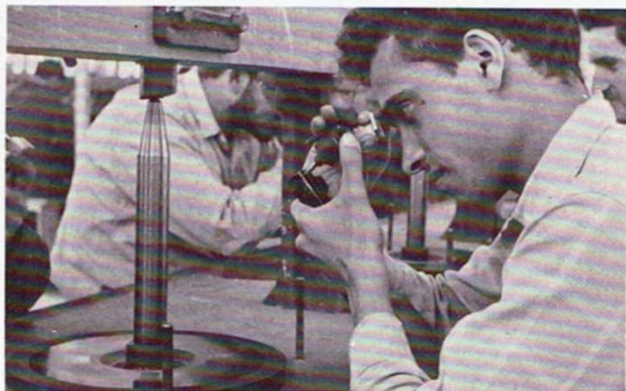
Diamonds are being polished...