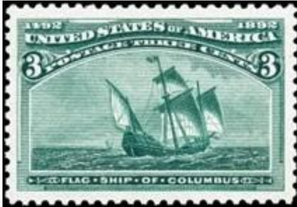
אחד הבולים מסדרת קולומבוס האמריקאית משנת 1893, המראה את ספינת הדגל של קולומבוס

אספנים מתחילים של בולי המאה ה-19 עומדים כמעט מיד על תאריך שהוא בבחינת "קו פרשת המים" של בולי הזיכרון (commemorative stamps) מרחבי העולם: ה-2 בינואר 1893. ביום זה הונפקו לציבור בולי "קולומבוס" וגילוי אמריקה" המרהיבים על ידי הדואר האמריקאי. עד היום סבורים רבים, כי בולים אלה הם בולי הזיכרון הראשונים בעולם 1 . אך האם זוהי אכן סדרת הבולים הראשונה שניתן לכנותם "בולי זיכרון"?