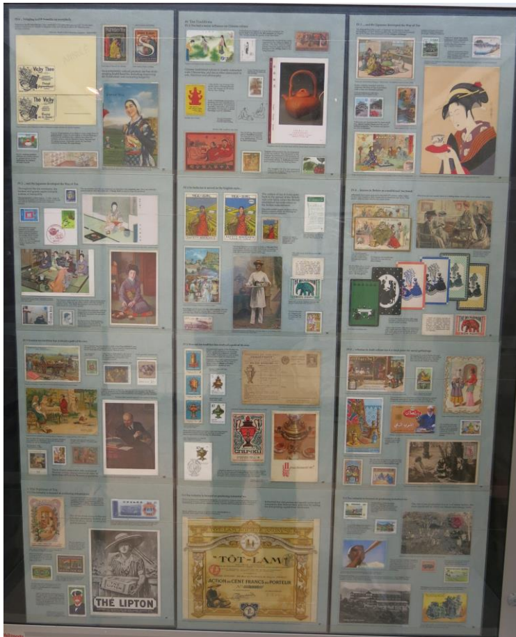
מסגרת מתוך תצוגה בנושא תה מהאגף הפתוח

הכוונה באגף הפתוח היא לאפשר לאנשים להוסיף מגוון חומר שאינו בולאי על מנת להציג סיפור מלא ומקיף. כך, למשל, ראינו תצוגה בנושא כבשים ובה דוגמאות צמר, והיתה תצוגה על תחרה (שכללה דוגמאות