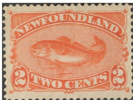
בולי ניופאונדלנד מראים טבע מקומי