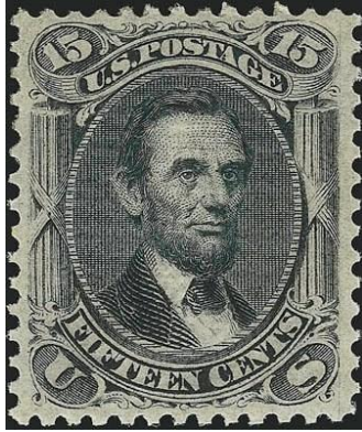
בול לינקולן, 1868