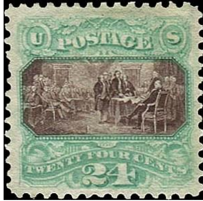
גילוי אמריקה והכרזת העצמאות האמריקאי מסדרת ה-pictorials של 1869.