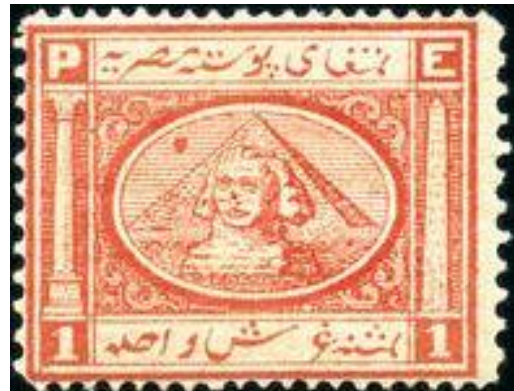
הפירמידות בבולי מצרים, 1867.

באור מציינ 7 , כי בול לינקולן מ-1866, שהונפק שנה בלבד לאחר הירצחו (ציון אירוע), עשוי היה להיות בול הזיכרון הראשון של ארצות הברית, אך למרות שענה על כל הקריטריונים של בול זיכרון, הוא לא זכה להיחשב ככזה. אולי היה זה בשל ממדיו הקטנים, שלא התאימו לנוסחה של בול זיכרון, המיועד במידה רבה למכירה לאספנים.