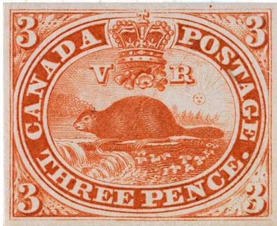
בול קנדי המציג את הבונה – בעל חיים שהוא סמל לאומי

א- פניהם של שליטים – מלכים, מלכות, נשיאים וראשי המדינה, חיים או מתים; ב- מספרים המבטאים את ערכם הנקוב של הבולים (למשל, בולי ת'רן וטאקסיס, או רבים מבולי ברזיל המוקדמים);