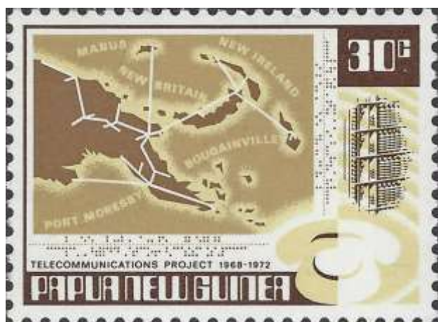
מפת רשת התקשורת