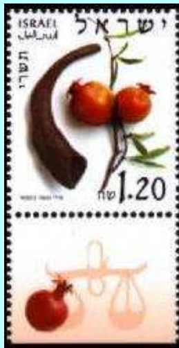
בול חודש תשרי - על גביו מוצגים ערבה, רימון ושופר

תשרי שפירושו התחלה, מציין את ראש השנה לפי המסורת. עם זאת, על פי הלוח המקראי זהו החודש השביעי מניסן. באקלים של ארץ ישראל יש שתי התחלות, בשתי עונות שונות, עם שינויים משמעותיים בטבע ובחקלאות. הטבע המתעורר נמצא בשיא פריחתו בחודש ניסן "החודש הזה ראש חודשים ראשון הוא לחודשי השנה" (שמות י"ב-ב'). הטבע גם מתעורר לשינויים שחלים בו מחודש תשרי, "חג האסיף בצאת השנה" (שמות כ"ג-ט"ז), כלומר, עם צאת הקיץ בתשרי בא הסתיו. ראש השנה חל באחד בתשרי, יום הכיפורים בעשרה בו והימים שביניהם נקראים "עשרה ימי תשובה" או "בין כסה לעשור".