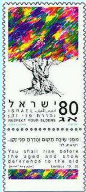
מעשים טובים - בול "והדרת פני זקן"

השגחתו של האל. כלומר, התורה מקבלת את כל היהודים באשר הם וללא תנאים – החילוני עם הדתי, בעל המעשים הטובים יחד עם חסר המעשים הטובים. בכל ימי החג, מלבד שבת, נוטלים לולב, כלומר נוטלים את האתרוג ביחד עם הלולב, שלושה הדסים ושתי ערבות, ולפני שקיעת החמה מברכים על הלולב ביחד עם ברכת "שהחיינו" כאשר את האתרוג מחזיקים ביד שמאל ואת שאר המינים מחזיקים ביד ימין.