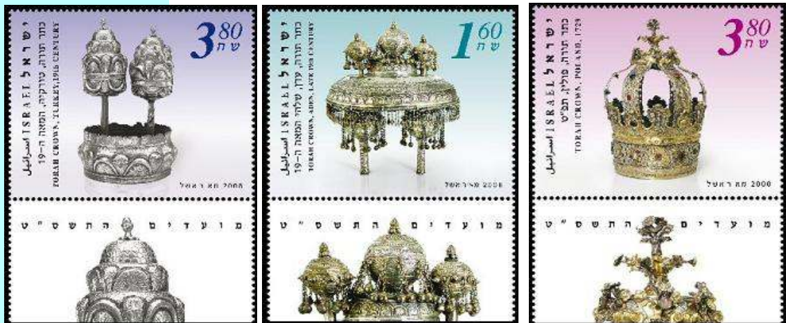
בולים המציגים כתרי תורה עתיקים

בתקופת בית המקדש, היו נוהגים לשפוך מים על המזבח בזמן החג כהודאה ובקשה להורדת גשמים בחורף המתקרב. הדבר היה מלווה בחגיגות גדולות ובשמחה מרובה, עד שנאמר: "מי שלא ראה שמחת בית השואבה, לא ראה שמחה מימיו". כיום נהוג לשיר, לרקוד ולשמוח במהלך ימי החג בכדי לציין את שמחת בית השואבה.