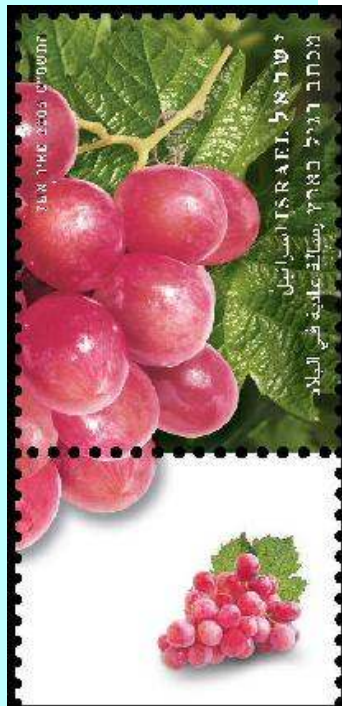
חג האסיף - אוספים את היבול מהשדות והכרמים

חג הסוכות מתחיל 5 ימים אחרי יום הכיפורים, בט"ו בתשרי ונמשך 7 ימים. את החג נוהגים להעביר בסוכה, מחוץ לכותלי הבית, בה נאכל, נשתה, נשמח ונישן. אפרופו, הסוכה היא זכר לסוכות שאבותינו ישבו בהם במדבר בזמן יציאת מצרים, כפי שנאמר: למען ידעו דורותיכם כי בסוכות הושבתי את בני ישראל בהוציאי אותם מארץ מצרים (ויקרא כג, מב-מג). את הסוכה מתחילים לבנות עם צאת יום הכיפורים.