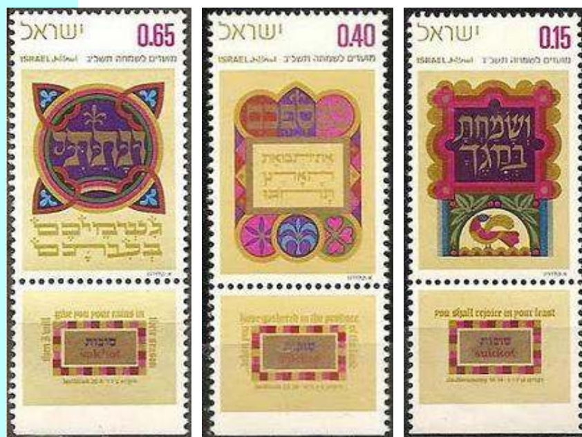
"ושמחת בחגך", "באספכם את תבואת הארץ", "ונתתי גשמיכם בעיתם" – בולי מועדים 1971

חג שסוכות, מעבר להיותו חג דתי, הינו חג חקלאי. משולבים בו המון אזכורים ודימויים מעולם הטבע והחקלאות, הוא המקשר בין העצב והתוגה של ראש השנה ויום הכיפורים לשמחת החג, מהווה מעבר רשמי מאיסוף היבולים לתחילת הזריעה ולבסוף סיום העונה החמה ותחילתו של החורף. זהו חג אשר סוגר מעגל מצד אחד ומתחיל מעגל מצד שני. זו הסיבה מדוע עלינו לשמוח בחג שזה שנאמר "ושמחת בחגך, והיית אך שמח".