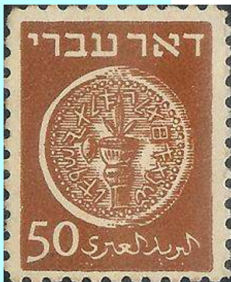
ארבעת המינים על בול ישראלי - המינים מופיעים על מטבע עתיק מימי בר כוכבא

מצווה נוספת, חשובה לא פחות, הקשורה לחג הסוכות, היא מצוות ארבעת המינים. עלינו לקחת 4 מיני צמחים: