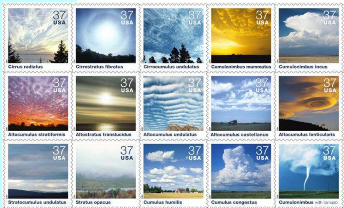
בולי עננים מארצות הברית

הצללים מתארכים גם בצהרי היום כי השמש הנמיכה בזווית קו הרקיע. גם ימי החמסין היבשים באים להכריז על גסיסת הקיץ והופעת הסתיו. יום חם מתחלף ביום קריר, יום בהיר ביום מעונן ויום לח ביום יבש, זאת עונת הסתיו ותהפוכותיה. גם שנה חדשה נכנסת עם צפונותיה, האם תביא גשמי ברכה בעקבותיה או ימים שחונים, ללא מטר, בכנפיה. משיב הרוח ומוריד הגשם, היא ברכת הסתיו והחורף, שמחליפה את ברכת מוריד הטל של הקיץ. התבואות נאספו בשדות, חג האסיף חולף ועיני כולם נשואות לשמים כדי לראות סימנים לענני גשם שיביאו עימם שפע לשנה החדשה.