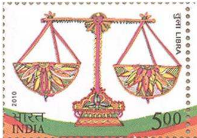
סמל מזל מאזניים על בול מהודו

בחודש תשרי יש יותר חגים ומועדים מכל חודש עברי אחר ואלו הם: ראש השנה, צום גדליה, עשרה ימי תשובה, שבת שובה (שהיא "שבת תשובה" שבין ראש השנה ויום כיפור), יום הכיפורים, חג הסוכות, שמחת תורה ושמיני עצרת. ביום הראשון של ראש השנה, יש מנהג לצאת אל הנהרות ואל הימים כדי לומר את תפילת "תשליך", ("ותשליך במצולות ים את כל חטאותיהם", ספר מיכה, ז'-י"ט).