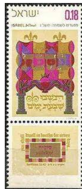
"בסכות תשבו שבעה ימים", "כי בסכות הושבתי את בני ישראל" – בולי מועדים 1971