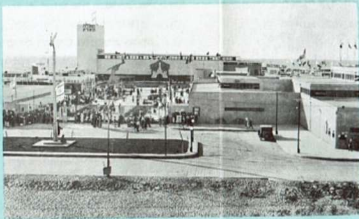
THE "LEVANT FAIR" OF 1934/36