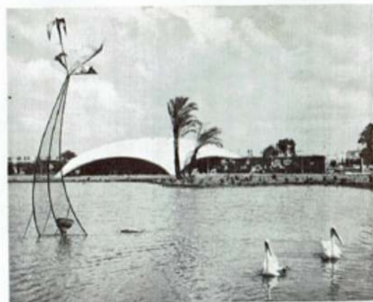
"EXHIBITION GARDENS" TEL AVIV WHERE THE "NEAR EAST INTERNATIONAL FAIR 1962" TAKES PLACE