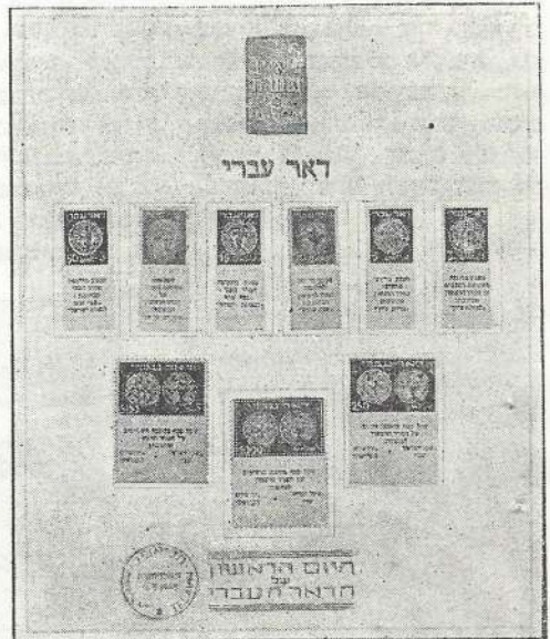
גליונות חגיגיים עם "דואר עברי" ל"אימאבה" ואישים רמי-מעלה