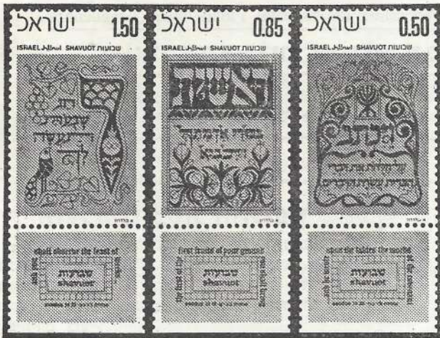
הבולים יופיעו ב־25 במאי 1971