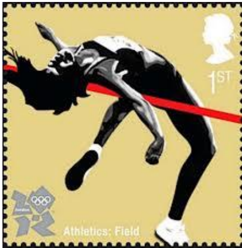
כיום הכל קופצים בסגנון גלילת הגב

לעיתים ספורטאי משתמש בטכניקה אחרת כדי לשפר את תוצאותיו. הקופץ לגובה האמריקאי דיק פוסברי המציא את שיטת הקפיצה הקרויה גלילת הגב (לעיתים מכנים את השיטה על שמו "סגנון פוסברי"). בעזרת השיטה החדשה הוא זכה במדליית הזהב במשחקים האולימפיים במקסיקו 1968, וכיום כמעט כל הקופצים בעולם משתמשים בסגנון זה. איש לא הכריח אותם לעשות זאת – הם פשוט הבינו כי אם ידבקו בסגנון הישן הרי שתוצאותיהם יפגרו אחרי מתחריהם.