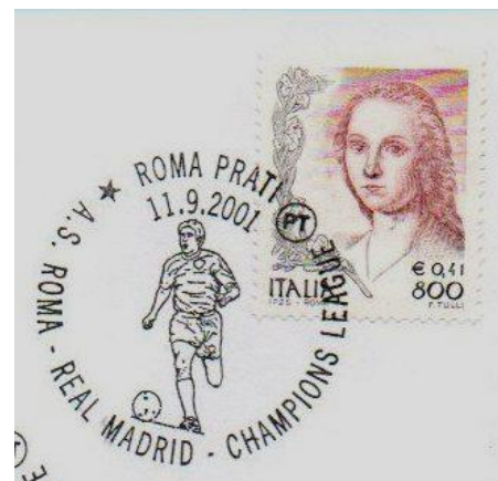
מועדונים עשירים כריאל מדריד וברצלונה זוכים ברוב התארים

יש להתייחס גם להבדלי השיפוט ברמה הלאומית וברמה הבינלאומית. אני נוהג להשוות זאת לבית המשפט המחוזי ולבית המשפט העליון. המטרה העיקרית בשיפוט הלאומי היא לתת לתצוגה ניקוד הוגן, כך שבמידה והיא תישפט ברמה הבינלאומית היא תקבל ציון דומה. סטייה של 2-3 נקודות היא סבירה בהחלט, גם אם הדבר מתבטא בהבדל של מדליה. לעומת זאת הפרש של חמש נקודות ומעלה יעיד כי השיפוט ברמה הלאומית לא היה טוב. לעיתים זה נובע מכך ששופטים ברמה הלאומית נוטים להקל עם מציגים בני ארצם. הדבר גורם להטעיית המציג (שחושב שתצוגתו שווה יותר ממה שהיא באמת) ועתיד לגרום לו אכזבה קשה כשיקבל את הניקוד ברמה הבינלאומית.