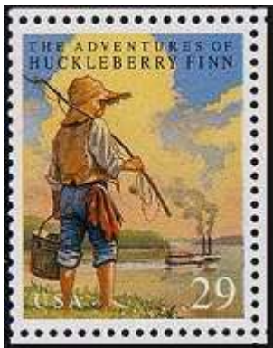
הרפתקאותיו של הקלברי פין על בול מארה"ב

1897, עיתון מקומי מימן את נסיעתו של מרק טווין לאגן הים התיכון. את חוויותיו במסע זה הוא כתב בספר העונה לשם "תמימים בנכר". אחד הפרקים מן הספר עוסק בחוויותיו של הסופר בפלשתינה של אותם ימים והוא תורגם לעברית תחת השם "מסע תענוגות לארץ הקודש". הסיפור מתאר באופן ציני אך סוריאליסטי את החיים בארץ ישראל באמצע המאה ה-19 וזכה לפופולאריות רבה בקרב יהודי העולם. רבים טענו בזמנו כי בעקבות קריאת הספר הם חשו צורך עז לעלות וליישב את ארץ ישראל, ולראייה גלי העלייה שהחלו רק כ-20 שנה מאוחר יותר, לקראת סוף המאה – כנראה של אותם ילדים שהתבגרו בינתיים. במהלך המסע לארץ ישראל פגש טווין את צ'רלס לנגדון, מי שהפך מאוחר יותר לגיסו שכן ברגע שצ'רלס הראה לטווין תמונת אחותו, התאהב בה טווין. כשחזר לארצות הברית נשא אותה לאישה. לאחר נישואיהם עבר הזוג הטרי לקונטיקט, שם בנו את ביתם שהפך מאוחר יותר למוזיאון מרק טווין. במהלך חייהם בקונטיקט כתב טווין את יצירותיו הפופולאריות ביותר שעסקו בתום סויר והאקלברי פין.