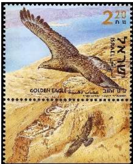
עוט זהוב מעל מצדה. העיט היה סמלו של הלגיון שצר על מצדה

ועל עשרת הגברים שעלו בגורל הוטל להרוג את שאר הגברים. הגרלה שניה נערכה, ובה הוטל על גבר אחד להרוג את תשעת הנותרים ולהתאבד.