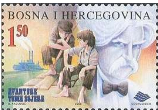
בול מבוסניה-הרצגובינה. מצד שמאל ניתן לראות ספינה שטה במיסיסיפי

מרק טווין גדל במדינת מיזורי, על גדות נהר המיסיסיפי ורצה להיות משיט ספינות בנהר. הוא זכה להגשים את חלומו ועבד בצעירותו בעבודה זו אך ב-1861 הקריירה שלו נגדעה עקב מלחמת האזרחים. הוא ניסה את מזלו בעבודות נוספות, רבות ומגוונות, ביניהם כריית מחצבים וחיפוש מתכת הכסף בנהרות. לבסוף, לאחר שעבד גם כמדפיס וגם כשוליה בעיתון, הוא זכה לכתוב בעיתון מקומי בנבדה.