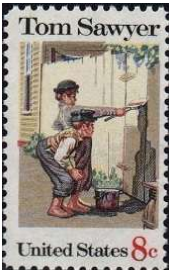
תום סויר על בול מארה"ב