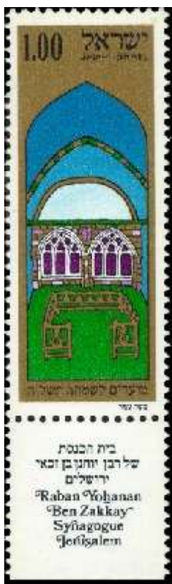
בית הכנסת על שם ריב"ז בירושלים

הובילו את הארון אל שערי העיר. משמרות המורדים, שניסו למנוע מיהודים לברוח (על מנת לאלצם להלחם ברומאים), רצו בתחילה לדקור את "הגופה" בחרב, על מנת לוודא את מותה, אך התלמידים שכנעו אותם שלא לבזות את גופתו של ריב"ז. מיד לאחר שהצליח לחמוק מהעיר הנצורה, התייצב ריב"ז בפני אספסיאנוס. בתלמוד הבבלי מתוארת הפגישה בין שני האישים, שנערכה בבית המרחץ. אספסיאנוס, מתלבש כאשר ריב"ז מובא בפניו. ריב"ז מפגין הבנה פוליטית וחוכמה כאשר הוא מברך את אספסיאנוס, ופונה אליו בתואר "קיסר", למרות שהוא היה רק מפקד לגיון. אספסיאנוס מפגין ניכור ותקיפות כלפי ריב"ז ומבהיר לו שעליו להרוג אותו משום שאו שהוא מורד בקיסר הלגיטימי, או שהוא העז שלא להתייצב בפניו לפני כן. ריב"ז מבהיר לו שלא יכול היה לעזוב את העיר לפני כן בשל משמרות המורדים שמנעו יציאה ממנה. לפי התלמוד מיד לאחר מכן נכנס חייל רומאי נרגש לבית המרחץ ומספר לאספסיאנוס שהקיסר נרצח, ושהוא מונה לקיסר. אספסיאנוס המופתע מתחיל לשנות את גישתו כלפי ריב"ז, שמסביר לו שירושלים תיפול רק לידי ראש מדינה, ולכן הוא הבין שהוא יהיה קיסר. בשלב זה אספסיאנוס נתקל בבעיה מביכה. הוא הספיק לנעול סנדל אחד, וכעת הוא אינו מצליח לנעול את סנדלו השני אך גם אינו מצליח להסיר את הסנדל הראשון. ריב"ז מבהיר לו שהוא התרחב מנחת בגלל הידיעה המשמחת על "קידומו" הבלתי צפוי, ואף מיעץ לו עיצה, כיצד לצאת ממצבו המביך: עליו