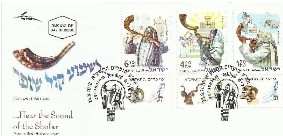
ריב"ז פסק שיש לתקוע בשופר בכל עיר שיש בה בית דין

דרכי נתן מתוארת שיחה בין ריב"ז לבין תלמידו, ר' יהושע: "פעם אחת היה רבן יוחנן בן זכאי יוצא מירושלים והיה ר' יהושע הולך אחריו וראה בית המקדש חרב. אמר רק יהושע: אוי לנו על זה שהוא חרב מקום שמכפרים בו עונותיהם של ישראל. אמר לו: בני אל ירע לך יש לנו כפרה אחת שהיא כמותה. ואיזה, זה גמילות חסדים שנאמר 'כי חסד חפצתי ולא זבח'".