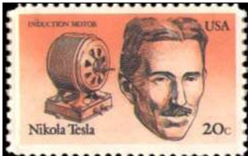
ניקולא טסלה על בול מארה"ב

שתיאודור הרצל היה עורך המגזין. במהלך חייו הרצה טוויין בפני אנשים רבים ובמקומות רבים בעולם. הרצאותיו היו מלאות באנקדוטות, ציניות והומור, עד כדי כך שרבים מחשיבים אותו כאבי הסטנד-אפ.