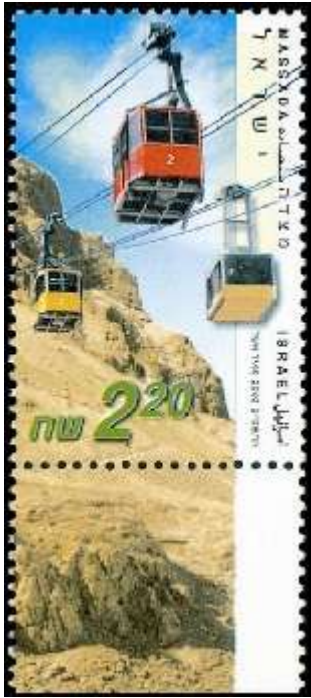
הרכבל למצדה. ברקע ניתן לראות את המצוק עליו היא נבנתה

נראה היה שהרוח שינתה כיוון והאש החלה לאיים על כלי המצור הרומי במקום על החומה, אך במהרה שנתה הרוח בשנית את כיוונה, ואז עלתה החומה באש. לקראת שעות הערב, לא עמד עוד שום מכשול בין הרומאים לבין פסגת ההר. מכיון שהערב עמד לרדת, החליט סילוה להעמיד שומרים על הפירצה, למנוע בריחה של הנצורים, אך לפרוץ למצדה רק עם אור ראשון. במהלך הלילה כינס מפקד המורדים, אלעזר בן יאיר, את הנצורים, ונשא בפניהם נאום, בו הוא שיכנע אותם כי עדיף להם לשים נפשם בכפם מאשר לפול חיים לידי הרומאים. לפי ספרו של יוסף בן מתתיהו, "מלחמת היהודים ברומאים" לא הסתפקו הנצורים בהחלטה להמית את עצמם בטרם יפרצו הרומאים אל ההר, הם החליטו גם לשרוף את רכושם על מנת למנוע מהרומאים אפילו את רוח הביזה. רק את המזון הם השאירו, כדי שידעו הרומאים שהם לא סבלו חרפת רעב. על הגברים הוטל לשרוף את הרכוש ולהרוג את נשיהם וילדיהם. לאחר מכן נערכה הגרלה,