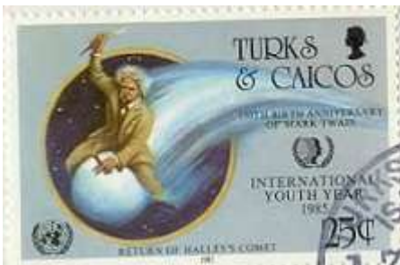
מרק טווין רוכב על שבט

הסופר האמריקאי המפורסם מרק טווין הביא לעולם יצירות מופת ודמויות מדהימות כמו תום סוייר והאקלברי פין ורבים מתייחסים אליו כאל אבי הספרות האמריקאית. הוא זכה לתהילה רבה על כתביו והיה ידידם של נשיאים, תעשיינים ובני אצולה מאירופה. כתיבתו התאפיינה בפשטות וקלילות המשלבת הומור וסאטירה נוקבת, תיאורים סוריאליסטים ובהתנגדות לאלים, דיכוי וצביעות. בין כתביו המפורסמים ביותר אפשר למצוא את "הרפתקאות תום סוייר", "הרפתקאותיו של האקלברי פין", "בן המלך והעני", "נגקי בחצר המלך ארתור" ועוד.