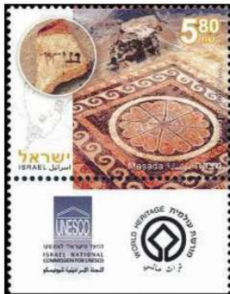
מצדה - אתר מורשת עולמית

שהובס בשלב זה, הרי שנשקפה לחייהם סכנה מוחשית, והורדוס החליט לברוח