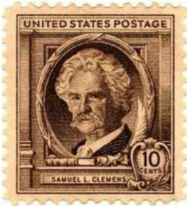
מרק טווין על בול מארה"ב

הסופר האמריקאי המפורסם מרק טווין הביא לעולם יצירות מופת ודמויות מדהימות כמו תום סוייר והאקלברי פין ורבים מתייחסים אליו כאל אבי הספרות האמריקאית. הוא זכה לתהילה רבה על כתביו והיה ידידם של נשיאים, תעשיינים ובני אצולה מאירופה. כתיבתו התאפיינה בפשטות וקלילות המשלבת הומור וסאטירה נוקבת, תיאורים סוריאליסטים ובהתנגדות לאלים, דיכוי וצביעות. בין כתביו המפורסמים ביותר אפשר למצוא את "הרפתקאות תום סוייר", "הרפתקאותיו של האקלברי פין", "בן המלך והעני", "נגקי בחצר המלך ארתור" ועוד.