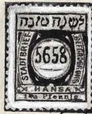
בול חברת „הנסה“ הופיע לפני כ־60 שנה