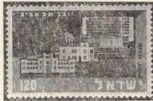
בול יובל תל-אביב.

ב'נין ועד הפועל של הסתד' רות העובדים הכללית, מופיע בבול כסמל לתנועת העבודה העברית, שתרמה את חלקה ה' ניכר בפיתוחה של העיר תל-אביב, בה מוצאים את משכנם רבבות פועלים עבריים". הבניינים שבבול צוירו ב' סגנון דו-ממדי.