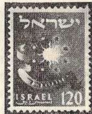
בול שבטים, 120 פ"ר הצייר: ג. הנורי

הדפסתו של בול על נייר שונה מזה שעליו הודפס הבול המקורי — דינו כדני בול חדש. בולאים רבים זוכרים ב-וודאי את הסערה שקמה ב-ארץ, עם הדפסת "בול