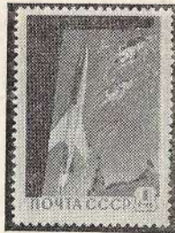
בול סובייטי חדש מראה את הלוויין ואת ה"ספוטניק"

עם התפתחותם של כלי התחבר-רה למיניהם, ניצלם מייד האדם ל-העברת ידיעות או צורות-דואר, וניתן להניח, שאחד מכלי-התעבורה הראשונים היתה הספינה, שעזרה לאדם לחצות ימים ואוקיאנוסים. כשהומצא המנוע והועמד לרשות האדם, החלו להעביר את צורות הדואר במכוניות, ברכבות ובכלי רכב אחרים. רק בראשית המאה הנוכחית הוכנסו לשימוש הדואר מטוסים, המשמשים לנו כיום להעברת צור-רות-דואר דחופים.