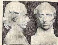
פסלו של פ. שופין מעשה ידי ס. ישינסקי

רבים חשבו תחילה, שמר יאשינסקי הינו יהודי. ברם ה"אמת היא, כי הוא נולד בוורשה בשנת 1908, כפולני בעל אמון נה דתית רומית קאתולית. את אומנות הציור למד ב"אקדמית האומנויות" שבקרוב והשתלם בוורשה.