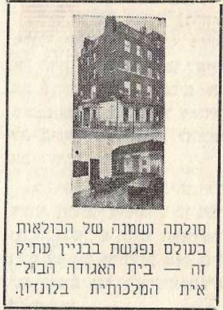
סולתה ושמנה של הבולאות בעולם נפגשת בבניין עתיק זה — בית האגודה הבולאית הממלכתית בלונדון.

ב-18 בחודש זה, 1909, הקיש לראשונה פטישו של יושבראש על שולחן-נשיאות בכנס-בולאים. היה זה במנצ'סטר, אנגליה. בכך נפתחה מסורת מפוארת (ר' מי כאנגלים שומרי מסורת?) של כינוסים שנתיים, שאינם מתקיימים רק בשנות-חירום ומלחמה בלבד.