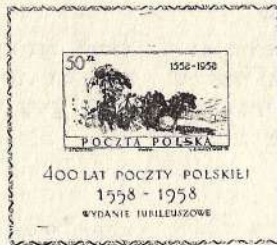
בול המשי הפולני הערך הנקוב 50 זלוטי

במירוץ אחרי החידוש או אחרי המקוריות הוציאו בעבר ההונגרים את בול האלומיניום (לציון 50 שנה לקיום תעשית האלומיניום בארץ זו), ואילו האיטלקים הוציאו את הבולים התלת"מימדים, שנמכרו לאספני בולים יחד עם זוג משקפיים דו"צבעיים. אלה האחרונים הופיעו לרגל קבלת מדינה זו כחברה באירגון האומות המאוחדות.