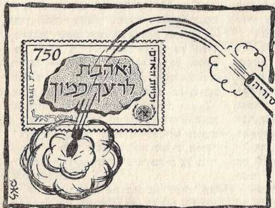
הופיע ב„אומר“ 12.12.1958