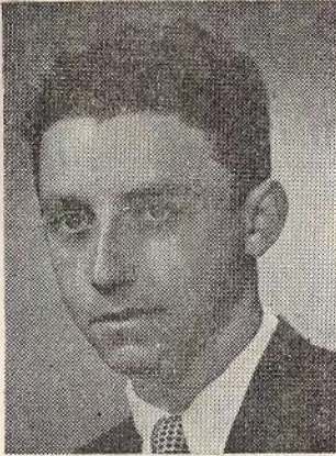
בולי ארה"ב מודפסים לפי שיטה שווייצרית

קצת צבעוניות החלה להופיע ב-בולי-הזכרון האמריקניים.