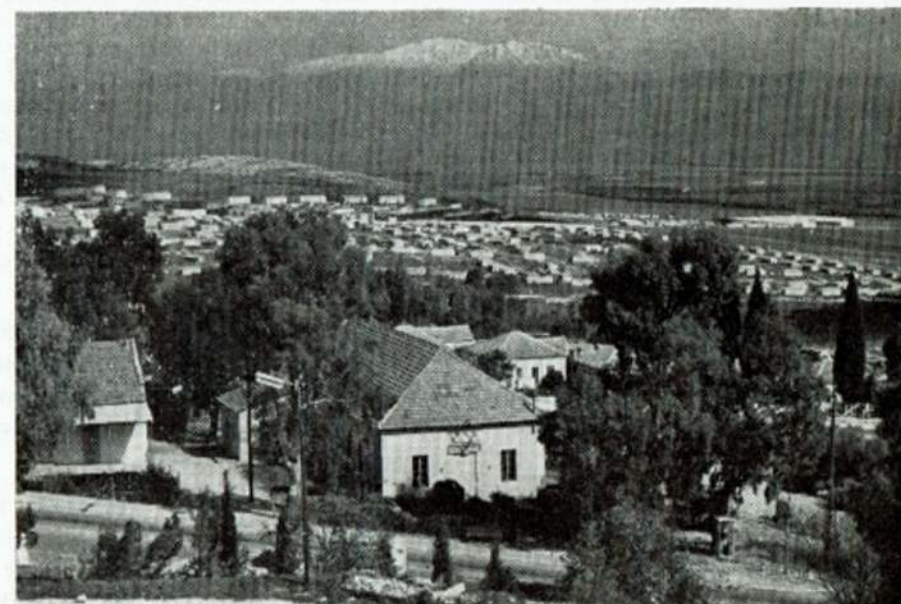
המושבה, עם החרמון ברקע