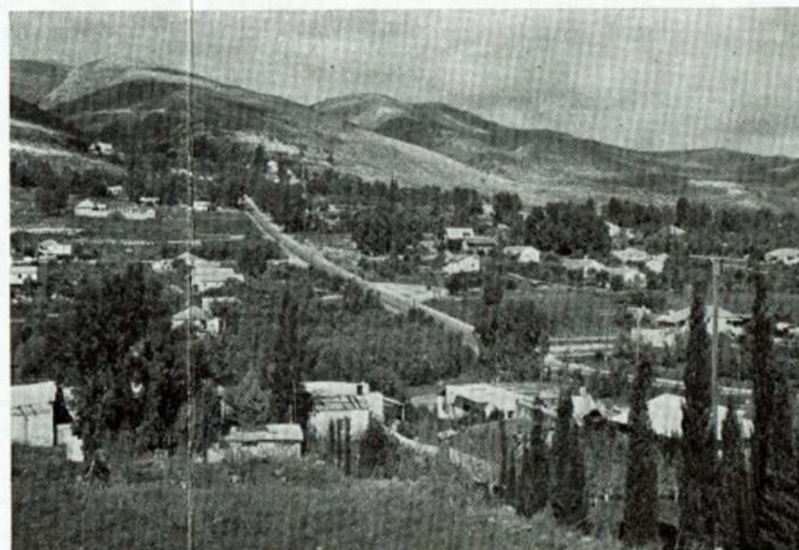
מראה כללי של המושבה מצד מזרח GENERAL VIEW FROM THE EAST