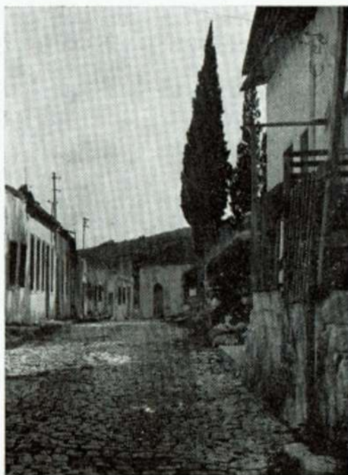
רחוב בראש פנה הישנה STREET OF OLD ROSH PINNA