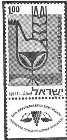
הכול צוייר בידי האחים שמיך מת"א. יום ההופעה — 25.10.71

וילקנסקי היה ממייסדי המכון ללימודי החקלאות של האוניברסיטה העברית ושהקים ברחובות והיה פרופסור לכלכלת המשק החקלאי. פירסם הרבה מאמרים וספרים בענייני חקלאות והתיישבות וכן בענייני ספרות.