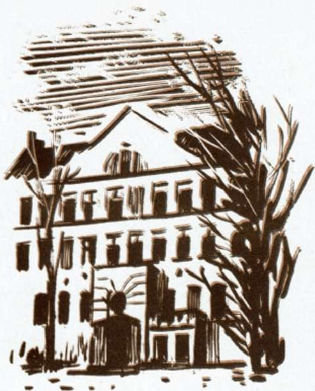
בית היתומים שבהנהלת יאנוש קורצ'אק, בוורשה