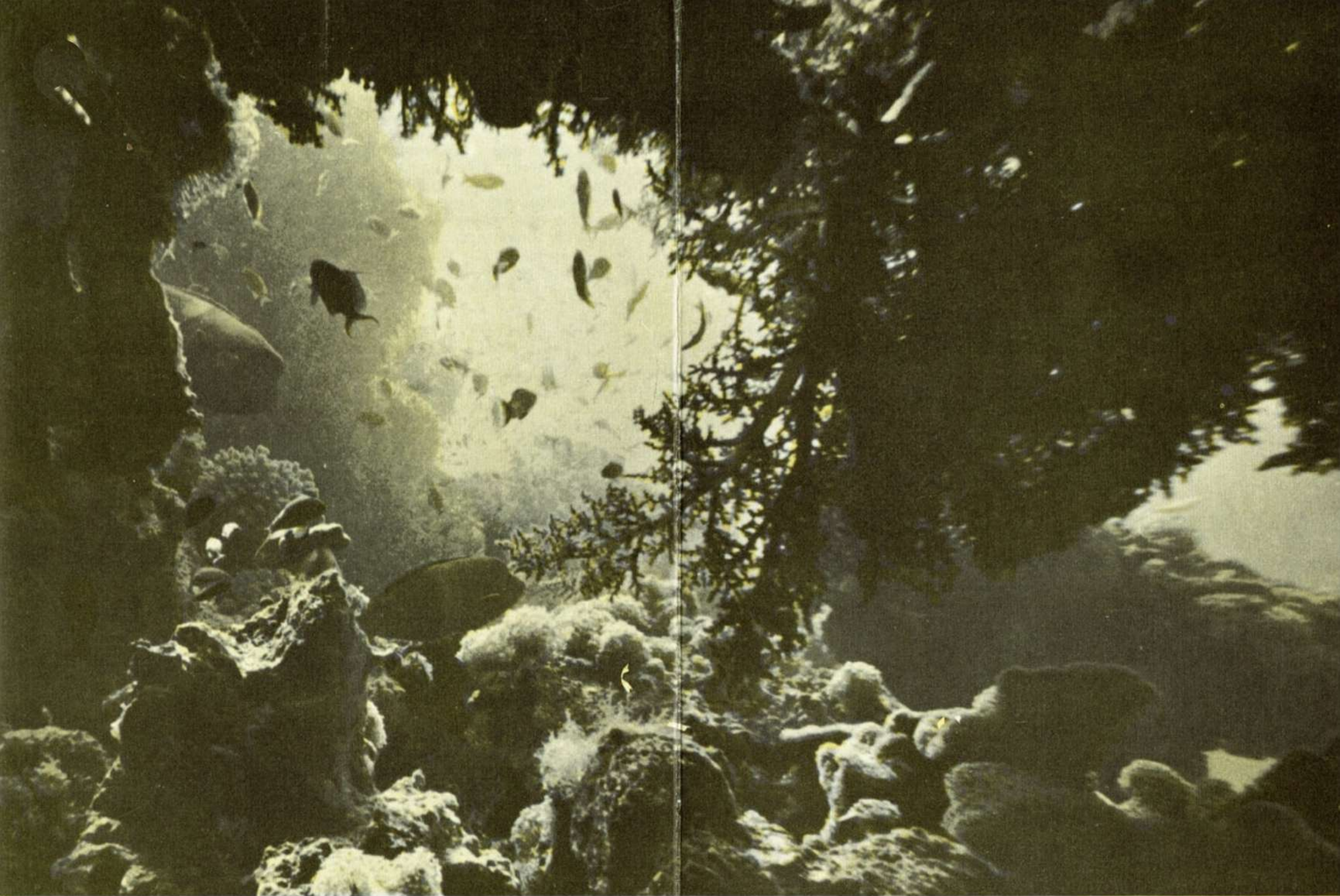
RED SEA FISHES OFF ELAT

הבולים צוירו ע"י מ. א. ג. שמיר, תל אביב THE STAMPS WERE DESIGNED BY M. & G. SHAMIR, TEL AVIV