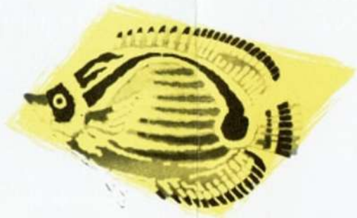
פרפרון — Chaetodon lunula

משושן הוא דג-האנטנה (בגלל הקרן הארוכה בחלקו הקדמי של סנפיר הגב) הוא תושב איזור החוף בימים הטרופיים. אורח חייו שונה בגילים שונים. הצעירים שגודלם 3-5 ס"מ חיים בלהקות קטנות בנות 15-30 דגים בלהקה. בתקופת חייהם זו הם נשאים זמן רב במקום אחד. כשהמשושן מתבגר הוא עוזב את הלהקה ומתחיל בחיי תנועה, לרוב בתוך מים רדודים ובסביבות בהן נמצאים אלמוגים. (אורכו עד 25 ס"מ).