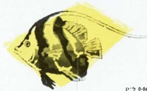
משושן — Heniochus acuminatus

This species is very common in the Elat coastal waters, especially among the reefs facing the open sea. The most interesting feature of the Angel fish is the changing of the colour pattern which takes place during the growth of the fish. The young specimens are black with concentric streaks of white or blue. The mature fishes are purple-brown with numerous oblique yellow bands and yellow paired fins. They feed on algae and little animals.