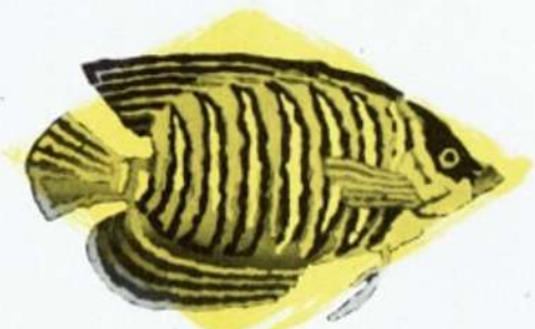
אימפראטור — Holacanthus imperator

This fish, as its name indicates, has a long pennant shaped appendage to its dorsal fin. It is found in the shallow coastal waters of Elat and other basins of the Red Sea. The young fish are stationary and live at a depth of 2 to 5 metres in schools of 15 to 20 fish. When the fishes mature, their mode of life is entirely different. They move freely through the labyrinth of the coral reefs and during the mating season they live in couples.