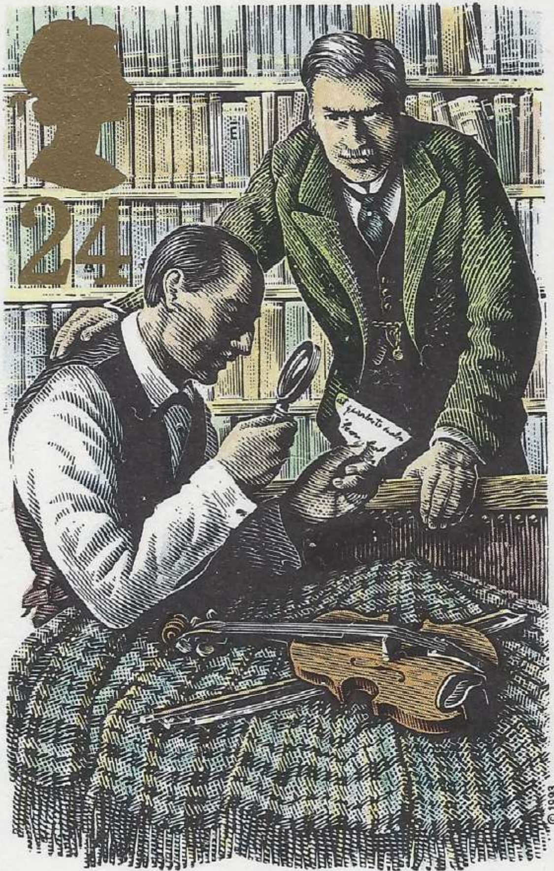
SHERLOCK HOLMES & DR. WATSON "THE REIGATE SQUIRE"