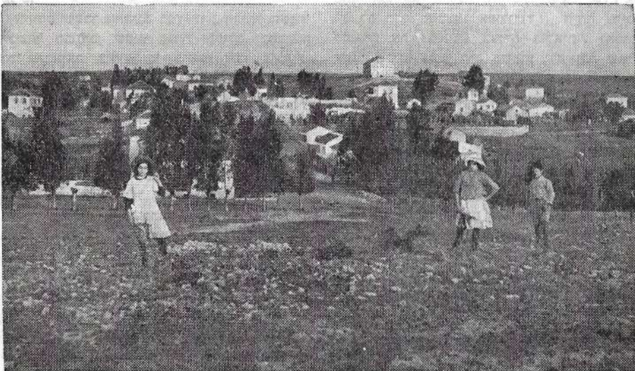
נוף רחובות בשנותיה הראשונות

גוש ההתישבות היה יחסית קרוב ליפו. העברת דואר נעשתה באמצעות כרכרת הדואר אשר עברה בגוש והוותה קשר חשוב בין הישובים לבין עצמם וקשר עם חוץ לארץ, שם חיו בני משפחות המת-ישיבים. היה זה הגיוני שהמתישבים נקטו בכל האמ-