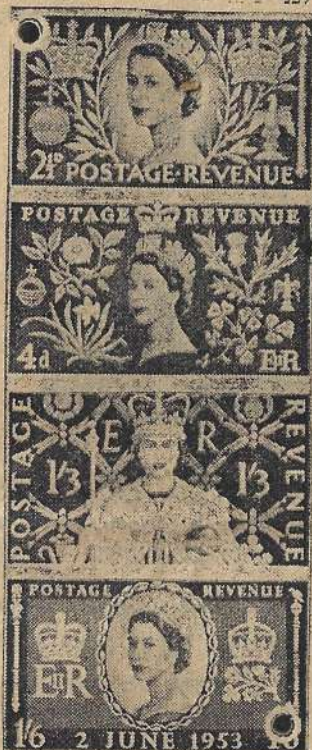
בולי ההכתרה של בריטניה

קובה: בול בן 3 ס' (סגול) מציינ את יום הולדתו של ד"ר רפאל מונטורו לפני מציאת הפניקס.