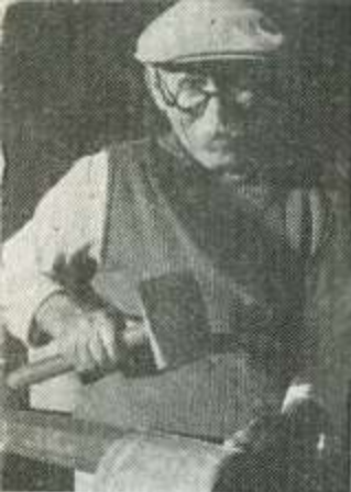
טוב לחיות ולעבוד בארצנו ... Feeling happy and at home.