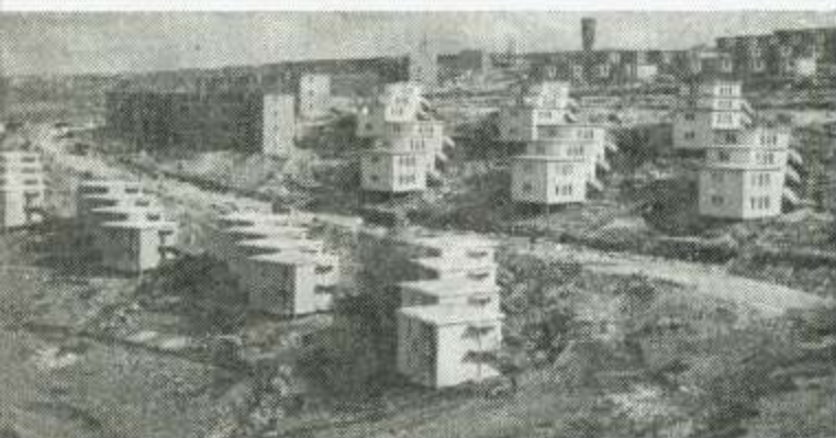
אחד משיכוני העולים החדשים.

One of the many new housing projects for refugees.