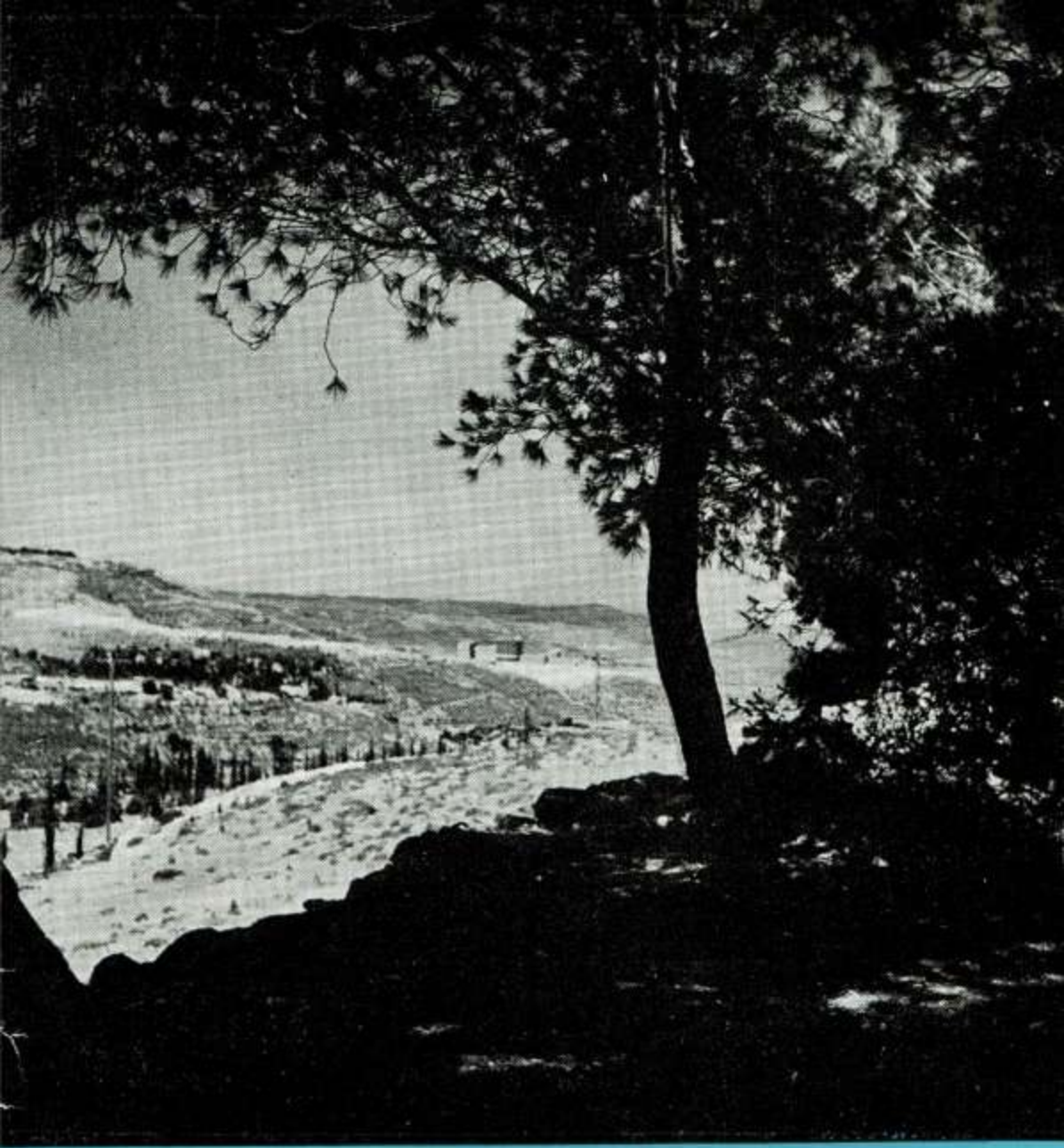
View from Mt. Herzl, Jerusalem