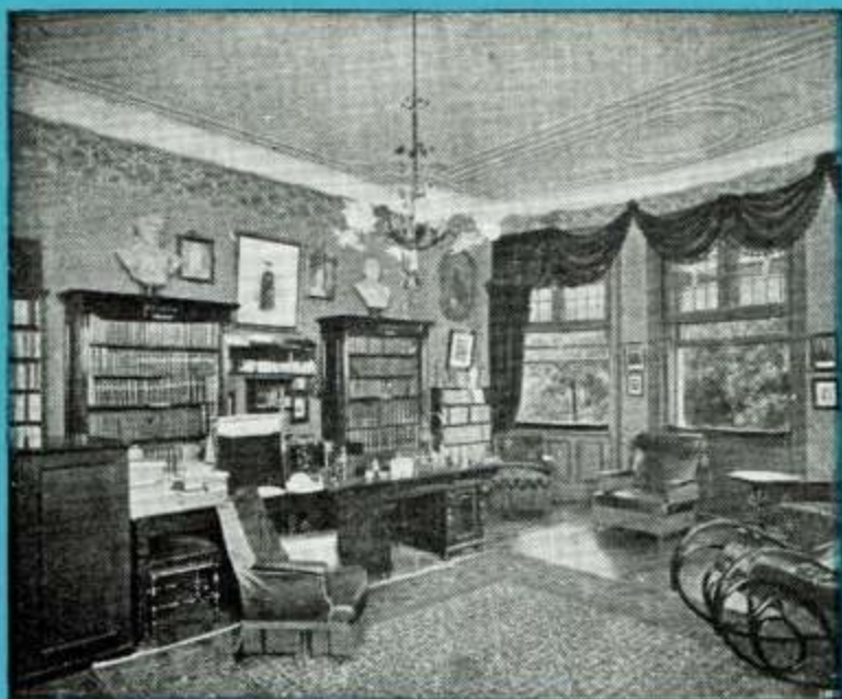
חדר העבודה של הרצל (כיום במוזיאון הרצל בירושלים) Herzl's study (today at the Herzl Museum, Jerusalem)