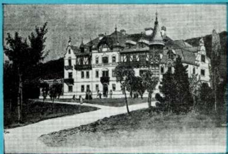
הבית בו נפטר הרצל בשנת תרס"ד Here Herzl died in 1904

ציירי הבול — האחים מ. את ג. שמיר, תל אביב.