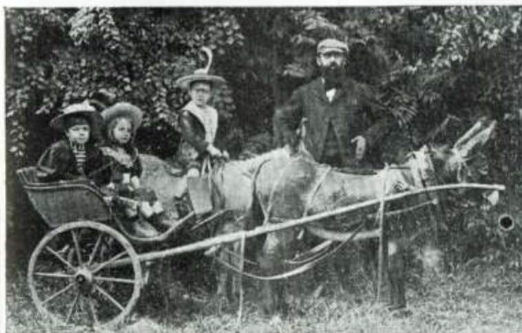
Herzl plays with his children