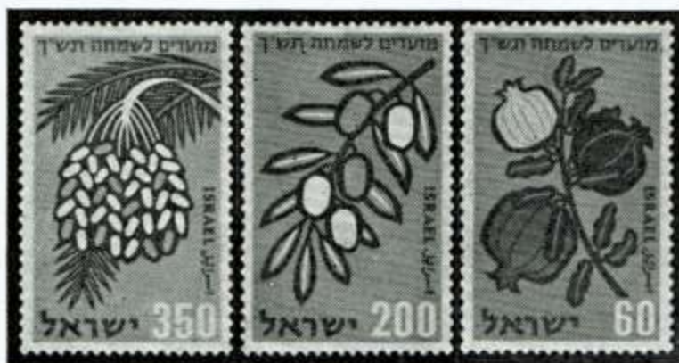
Festival Stamps — 5720 (1959)