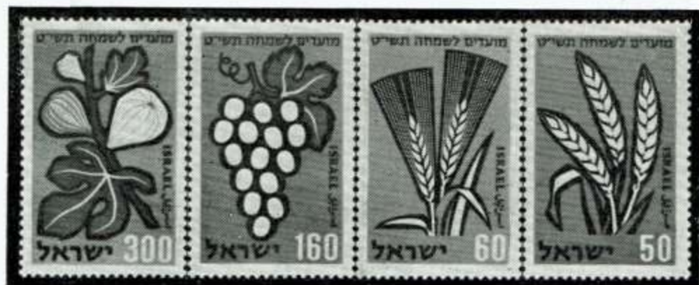
Festival Stamps — 5719 (1958)