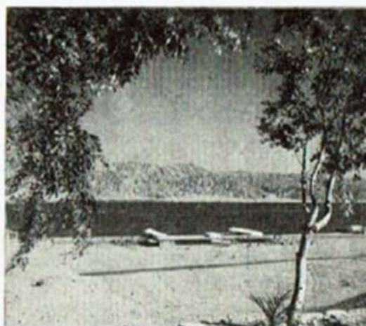
"OLD" INN AT ELAT — 1955