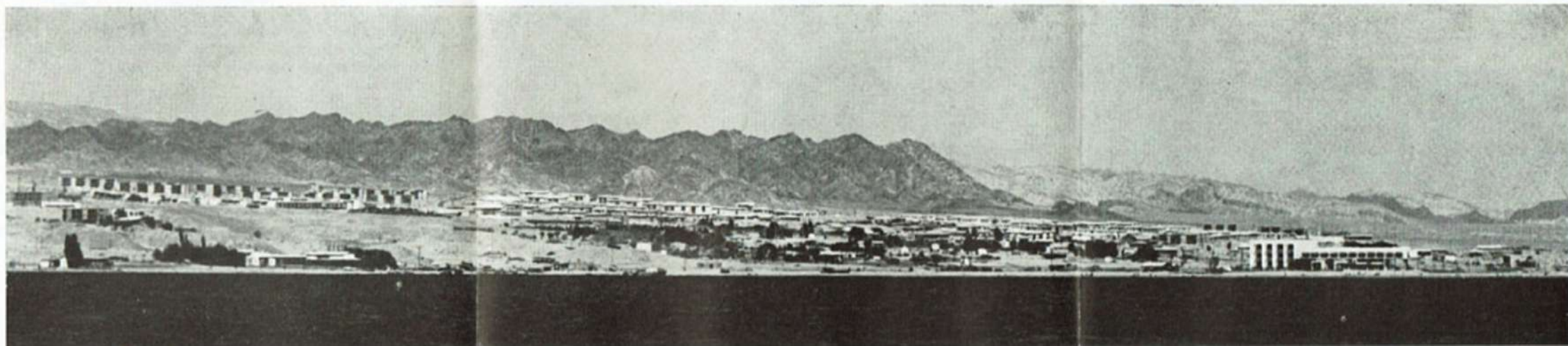
נוף אילת מצד הים