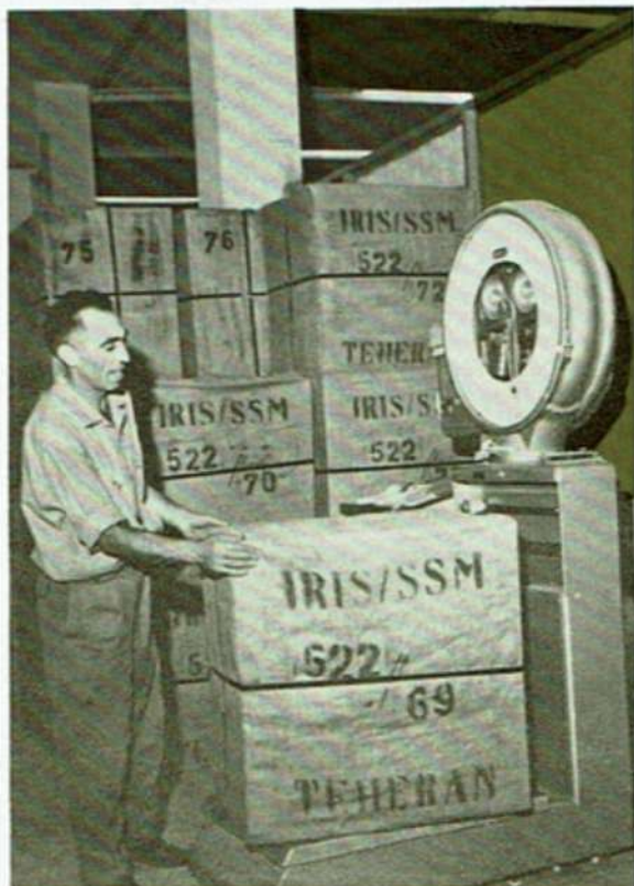
...ואריזתם למשלוח. ... and packed and weighed for despatch.