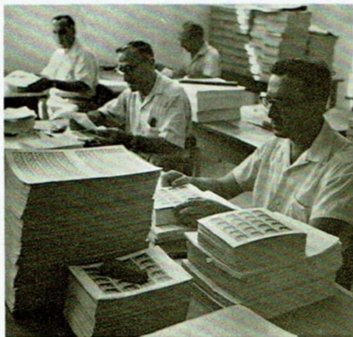
בדיקת בולי ישראל ואריזתם למשלוח. Stamps are being checked and packed