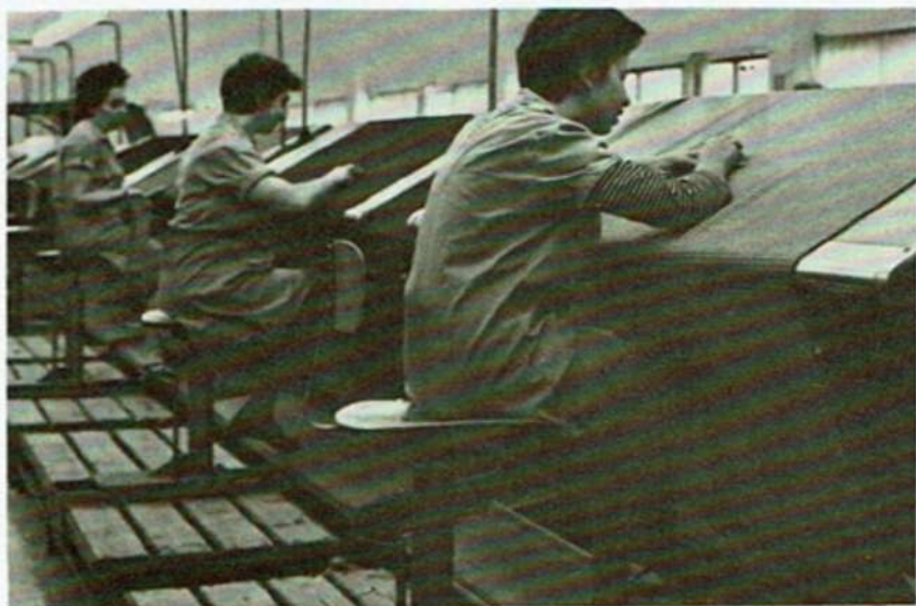
בדיקת בדים ליצוא... Cloth is being examined...