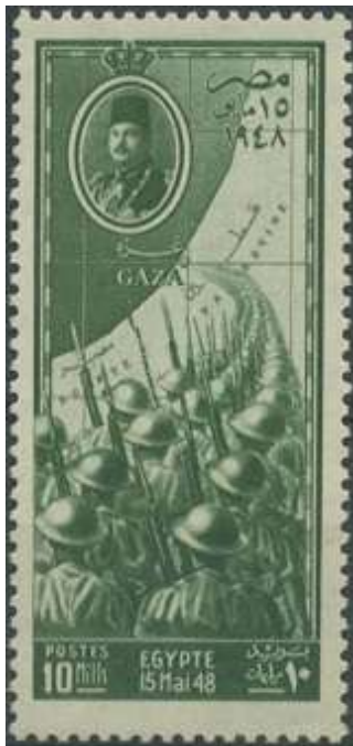
הבול המצרי שהונפק ב-15 ביוני 1948

לפני כשלושים שנה התחלתי לאסוף בולים בנושא הסכסוך הישראלי – ערבי. האוסף שלי התקדם יפה, וכיום אני מציג אותו בתערוכות תחת הכותרת: "מדינה יהודית – המאבק להשרדות", וכבר זכיתי למדליה מוזהבת גדולה ברמה הבינלאומית. במרוצת השנים השגתי כמה פריטים נדירים ומעניינים, ואני חושב שגם קוראי נושאונצ'יק יתעניינו בהם. מאמר זה הוא פותח סדרת מאמרים, אשר ל אחד מהם יוקדש לפריט אחר מתוך האוסף שלי.