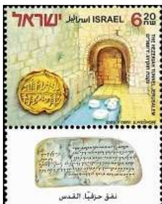
נקבת השילוח, 2005

מפעל המים המרשים הזה קיים עד ימינו, זוהי נקבת השילוח שנמצאת בגן הלאומי עיר דוד. בנוסף הוא ביצר את ערי יהודה. קטע מהחומה הצפונית של ירושלים ניתן לראות ברובע היהודי של ימינו, זהו אתר "החומה הרחבה", הנמצא סמוך לרחבה בחזית בית הכנסת "החורבה". המקרא מספר לנו על פעולות נוספות שביצע חזקיהו: בניית ערי מסכנות לדגן ולתירוש, ארגון מחדש של הצבא ואירגון מחדש של המנהל המרכזי. מעניין להיוכח ששוב הארכיאולוגיה מאמתת נתון זה. במספר אתרים מתקופתו נמצאו קנקנים עם חותמות "למלך". ככל הנראה מדובר על מסים שהועלו למלך (חשוב לציין שמדובר בתקופה בה טרם הומצאו מטבעות הכסף, ומיסים הועלו באמצעות גיוס לעבודה ולצבא או באמצעות תוצרת חקלאית).