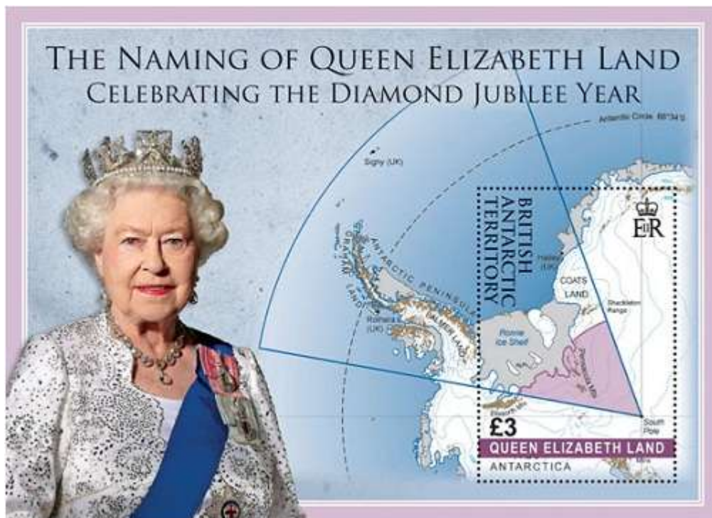
גליונית זכרון מהטריטוריה הבריטית באנטארטיקה מ-2012, לכבוד שינוי שמו של חלק מהטריטוריה ל"ארץ המלכה אליזבת"

מאפיין נוסף של בית המלוכה תחת הנהגתה של אליזבת' נעוץ באמונותיה הפרטיות. כאדם שמרן מטיבו, הרואה חשיבות בערכי המשפחה, הצליחה המלכה להימנע בכל שנות מלכותה משערוריות כמו זו של דודה אדוארד השמיני, וכמו אלו שנקשרו בבנה, יורש העצר צ'רלס, שנישואיו הכושלים לליידי דיאנה ספנסר וחיי האהבה שלו בכלל הכתימו את שמו הטוב של מוסד המלוכה.