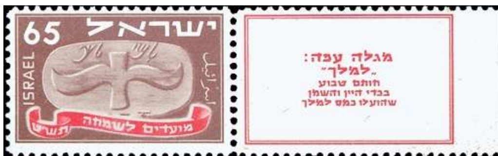
חותם "למלך", מועדים לשמחה התש"ט, 1948

מפעל המים המרשים הזה קיים עד ימינו, זוהי נקבת השילוח שנמצאת בגן הלאומי עיר דוד. בנוסף הוא ביצר את ערי יהודה. קטע מהחומה הצפונית של ירושלים ניתן לראות ברובע היהודי של ימינו, זהו אתר "החומה הרחבה", הנמצא סמוך לרחבה בחזית בית הכנסת "החורבה". המקרא מספר לנו על פעולות נוספות שביצע חזקיהו: בניית ערי מסכנות לדגן ולתירוש, ארגון מחדש של הצבא ואירגון מחדש של המנהל המרכזי. מעניין להיוכח ששוב הארכיאולוגיה מאמתת נתון זה. במספר אתרים מתקופתו נמצאו קנקנים עם חותמות "למלך". ככל הנראה מדובר על מסים שהועלו למלך (חשוב לציין שמדובר בתקופה בה טרם הומצאו מטבעות הכסף, ומיסים הועלו באמצעות גיוס לעבודה ולצבא או באמצעות תוצרת חקלאית).