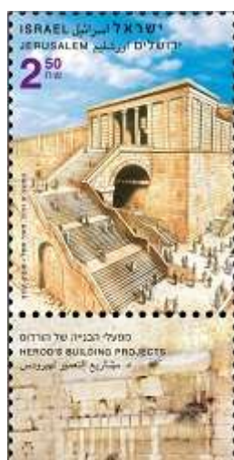
בית המקדש בירושלים, 2011

ראשית כל, מעט רקע על המלך חזקיהו ועל המצב הבין לאומי ערב מסע המלחמה של סנחריב. המלך חזקיהו עלה לשלטון בזמן שממלכת אשור היא הממלכה הדומיננטית במזרח הקדום. אביו של חזקיהו, אחז, ביקש את הגנת אשור מפני ארם דמשק וממלכת ישראל. האשורים נענו לבקשתו, פלשו לארם דמשק והוציאו את מלכה, רצין, להורג. בתמורה, הפך אחז את יהודה לממלכה וסאלית, קרי, ממלכה עצמאית אך כפופה לאשור, והחל לעלות מס לאשור. לא רק ארם דמשק חרבה – בשנת 722 לפני הספירה נפלה גם ממלכת ישראל לידי אשור וסופחה לאמפריה האשורית – להבדיל, ממלכת ישראל נהכה לפחווה של אשור, קרי חלק אינטגרלי מהטריטוריה האשורית. לפי המקרא היה זה שש שנים לאחר עלייתו לשלטון של חזקיהו.