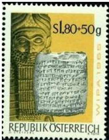
דוגמה לאנאלים אשוריים על בול מאוסטריה

כצפוי, האשורים לא ישבו בחיבוק ידיים כאשר שליטתם במערב האמפריה החלה להתערער. לאחר שסנחריב, יורשו של סרגון השני, הצליח להגיע לסוג של איזון עם בבל המורדת, הוא נערך למסע הלחימה במערב האמפריה. המקרא נוטה להתעלם מהמלחמה בין אשור לבין בעלי בריתה של יהודה, אולם מקורות אשוריים מתארים כיצד ברח מלך צידון אל הים, כאשר ראה את צבא אשור מאיים על עירו, וכיצד נכנעה אשקלון הפלישתית ומלכה נאסר על ידי האשורים והוחלף במלך "ממושמע" יותר. כאשר לפדי מלך עקרון שנאסר, כזכור, בירושלים לאחר שסירב להשתתף במרד, האנאלים של אשור מספרים: "את פדי מלכם הוצאתי מתוך ירושלים והמלכתי אותו עליהם."