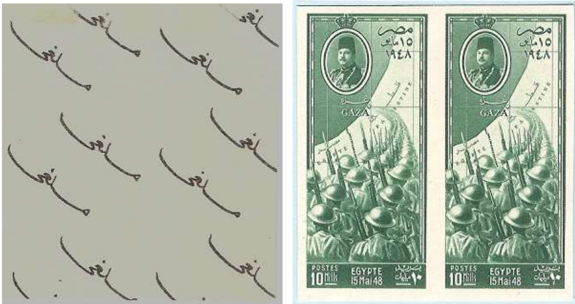
צמד הבולים הלא מנוקבב. משמאל: הצד האחורי של הבולים על הכתובת "מבוטל" בערבית.

עכשיו נחזור לבול שהוצג בעמוד הקודם. זהו בול נפוץ מאוד, מחירו נמוך, והוא נכלל בכל אוסף של הסכסוך הישראלי – ערבי. לפני מספר שנים הצלחתי למצוא תשנית מעניינת של בול זה. מסתבר שהמדפיס של בולי מצרים ייצר במיוחד עבור המלך פארוק גליון אחד של 50 בולים בלתי מנוקבים. הגליון נמכר במכירה פומבית אחרי הדחתו של המלך, והקונה פרק אותו לזוגות. אתם יכולים לראות שאין נקבוב מסביב לבולים או ביניהם. בצד האחורי של הגליון יש כתוב בערבית "מבוטל", וזה מוכיח שהבולים לקוחים מהגליון של פארוק ולא מגליון אחר שבטעות לא נוקבב.