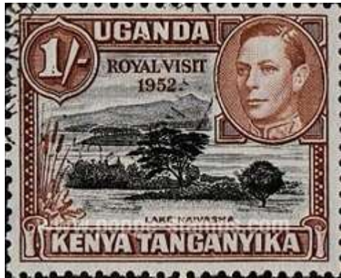
הבול מקניה אוגנדה וטנגנייקה

האחרונה, ביחד עם זנזיבר נקראת היום טנזניה) התארח הזוג המלכותי במלון "צמרות העץ" בת'יקה, המרוחקת שעתים נסיעה מניירובי. בהיותה שם נתבשרה על מות אביה ועל הפיכתה למלכה. בני הזוג חזרו בחפזה לאנגליה.